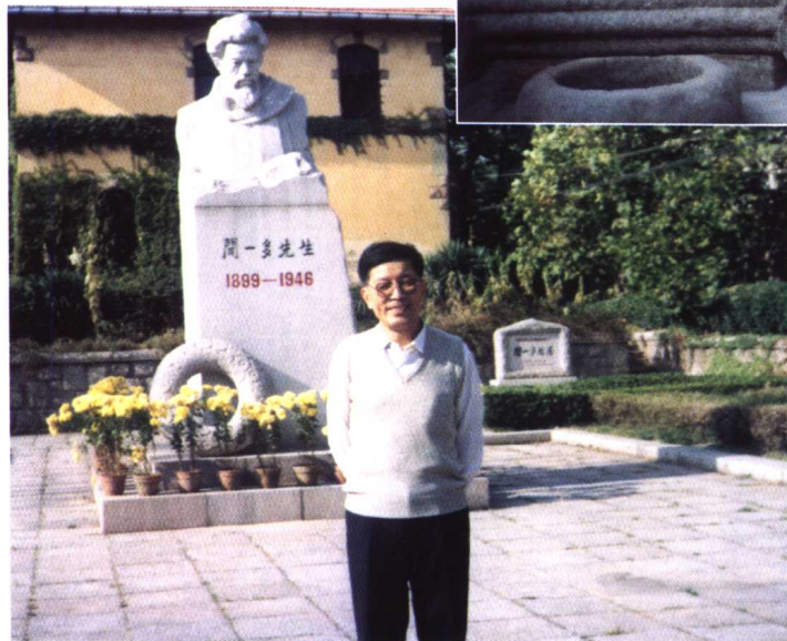
◀ 摄于母校山东大学青岛旧址