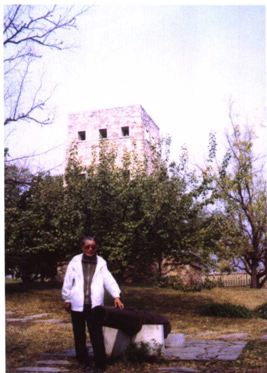
▲ 于京郊考察清代八旗兵训练遗址 (2004年10月24日摄)