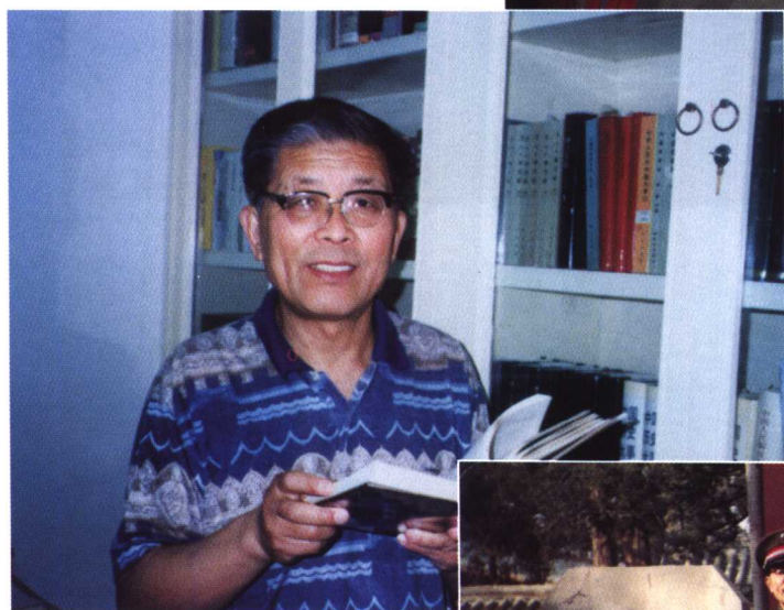
◀ 查阅文献资料 (1991年6月15日摄)