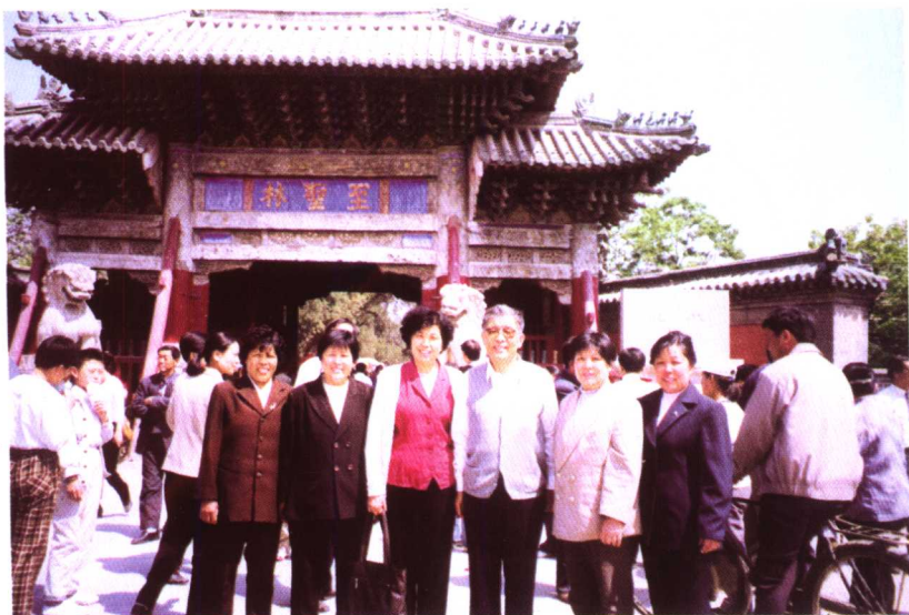
◀ 回故乡曲阜参观考察“三孔” 时于至圣林前同家人合影 (2000年5月摄)