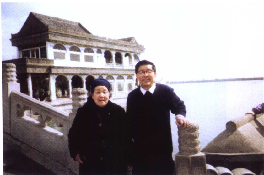
◀ 陪同母亲游览颐和园 (1996年12月摄)