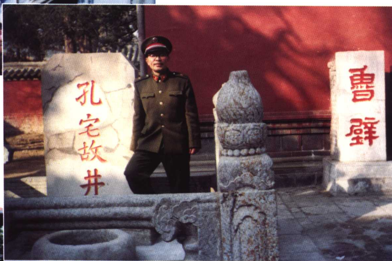
▲ 考察山东曲阜“三孔”文化古迹