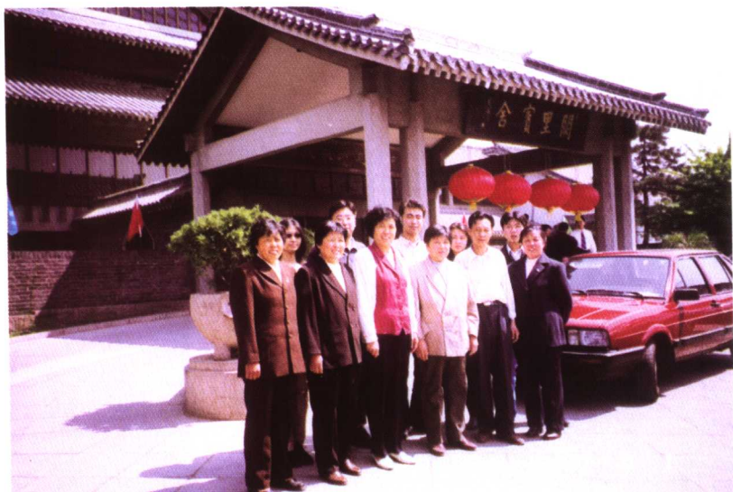
▶ 于曲阜阙里宾舍前同家人 合影 (2000年5月摄)