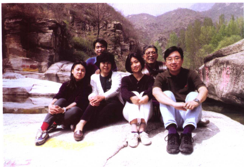
◀ 于京郊考察古战场途中同 家人合影 (1997年5月摄)