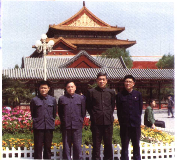
▶ 老领导、老战友、老同事，右一为作者。