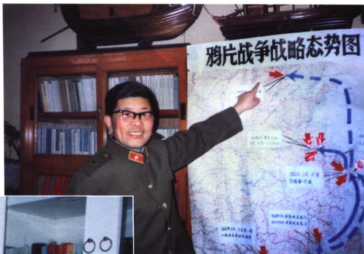
► 探讨鸦片战争的战略问题 (1987年2月5日摄)