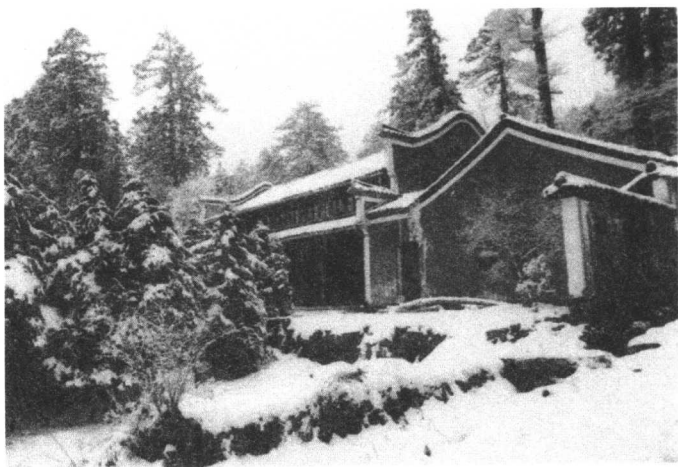
寒山寺：张继的《枫桥夜泊》引发多少人对寒山寺的向往。现实中的寒山寺显得冷清、落寞、颓败。

绕到了后面，除了壁上一块绍兴近人陶澐宣手书的“寒山寺”三个大字的横行石碑，也没有什么。退出来，到走廊的右方，钟楼紧闭着，柱上有一张六言告示，大意思是说，游客如果要参观里面的大钟，可以招呼茶房引导，但是要每人缴费五分，以资开销这一类话。扬着嗓子喊了好一会，