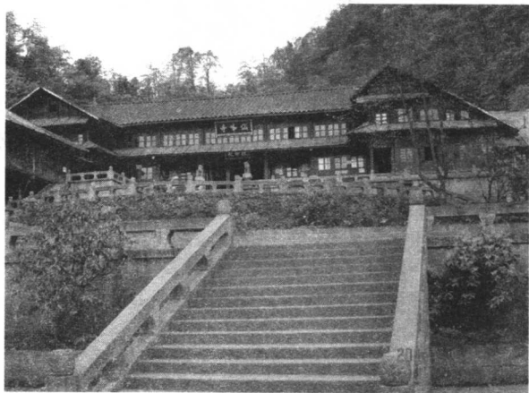
峨眉山仙峰寺：天下名山僧人占其半，仙峰寺与山林融为一景，远离俗尘，成为修行的佳地。