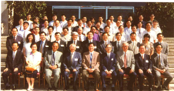
1997年第一届海峡两岸行政法学术研讨会(北京)