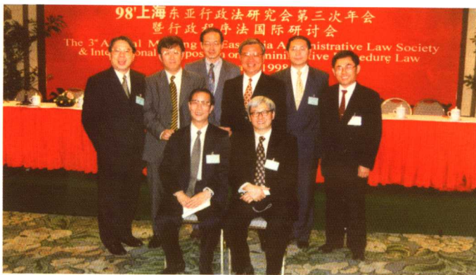
1998年第三届东亚行政法研究会年会暨行政程序法国际研讨会(上海)

1985年中国法学会行政法学研究会在常州成立，1997年第一届海峡两岸行政法学术研讨会在国家行政学院举行，1998年第三届东亚行政法研究会年会暨行政程序法国际研讨会在上海举行……行政法学国内、两岸、东亚乃至国际交流逐渐繁荣发展起来。