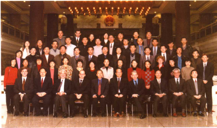
2001年行政许可国际研讨会(北京)