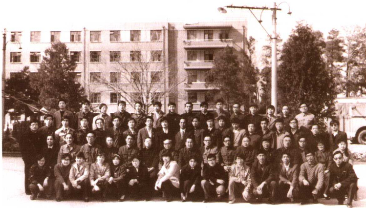
1985年中国政法大学“行政法师资进修班”