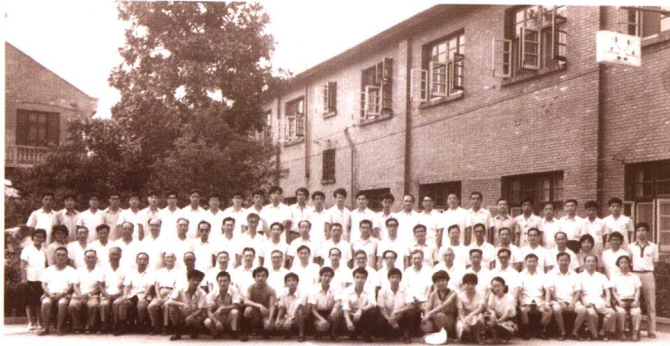
1985年中国法学会行政法学研究会成立(常州)