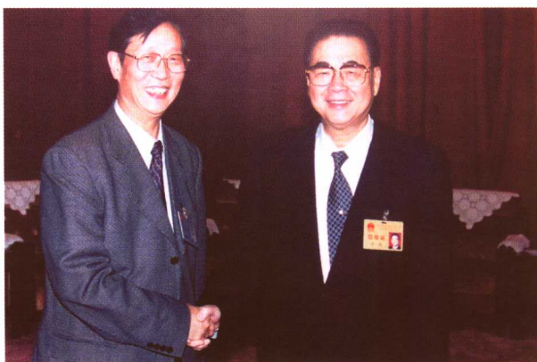
1999年全国人大常委会第十二次法制讲座前，与李鹏委员长