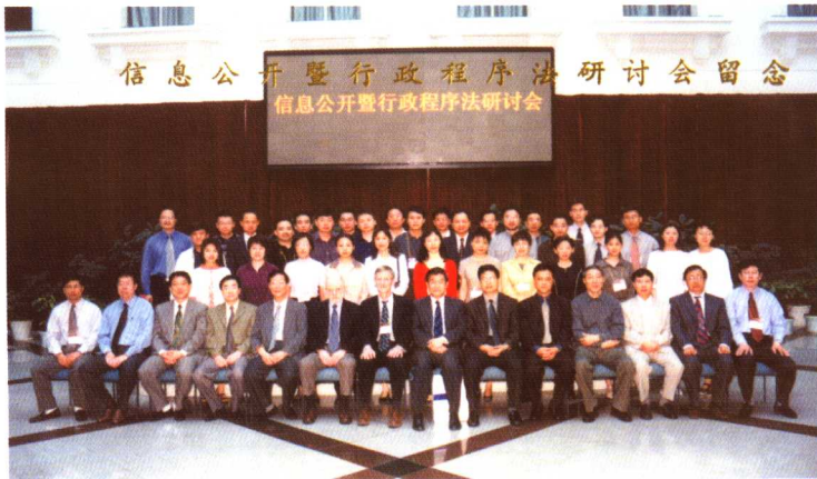
2002年行政程序法研讨会(天津)