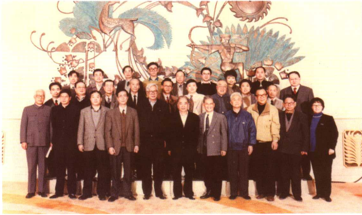
1987年全国人大副委员长会见行政立法研究组成员