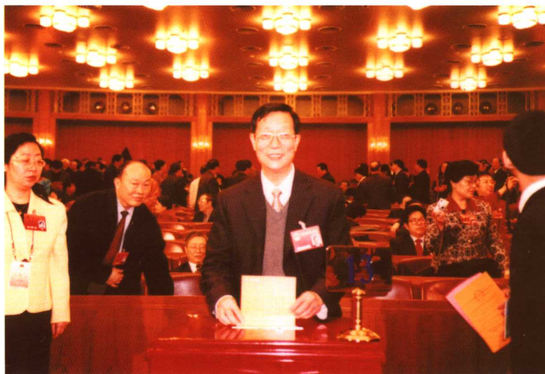
从1993年起被选为北京市人大代表，1998年起被选为全国人大代表。