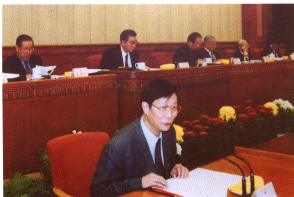
2003年全国人大常委会第二十三次法制讲座

1999年、2003年先后在全国人大常委会作法制讲座，题目分别是《我国的行政法律制度》、《行政程序法律制度》、《行政许可与行政强制法律制度》。