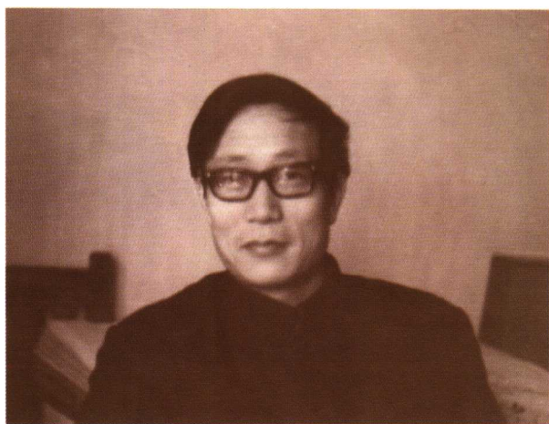
1984年到中国政法大学教书