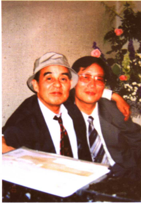
2003年与日本著名法学家室井力教授