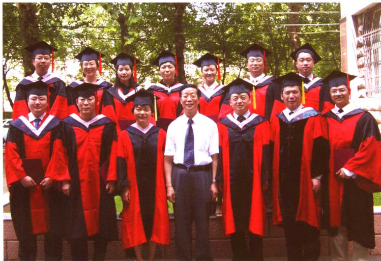
2006年与中国政法大学部分博士生导师及博士毕业生合影

教书匠是我乐得辛苦的事业，欣喜的是，学生们一批批成长起来，活跃在行政法学研究和行政法律实践的各个领域。