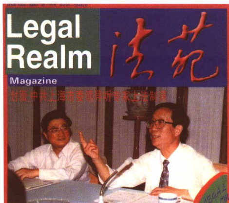
1997年为上海市政府作讲座，左为时任上海市市长黄菊