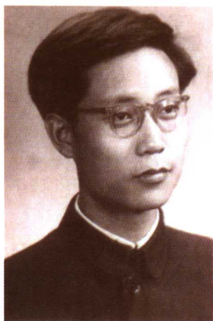
1960年从华东政法学院毕业时