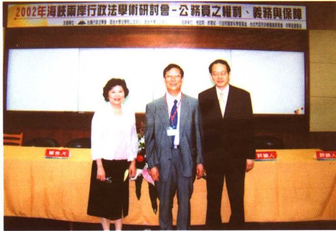
2003年与台湾行政法学家法治斌教授及夫人张明珠女士

为海峡两岸学术交流奔走辛劳的法治斌教授前年猝然离世，为日本法学乃至东亚法学作出杰出贡献的室井力教授今年六月驾鹤西去。