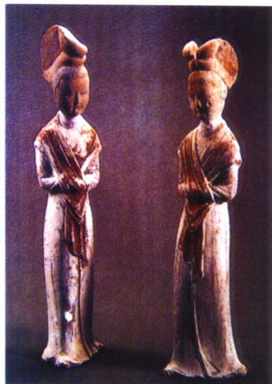
图 1-20 隋 彩绘陶女俑

隋朝短暂的统一为唐代的繁荣奠定了基础。从隋朝的陶瓷雕塑整体来看,造型较为清瘦、隽美,陶瓷雕塑更加丰富多样,彩绘陶已很普遍。(图 1-20)