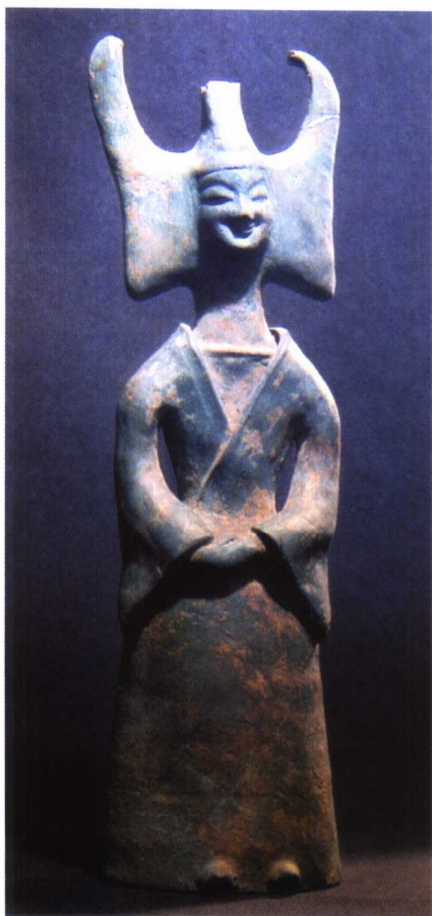
图 1-16 南朝 灰陶女俑