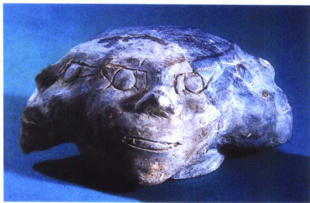
图 1-7 商代后期人面形陶器盖