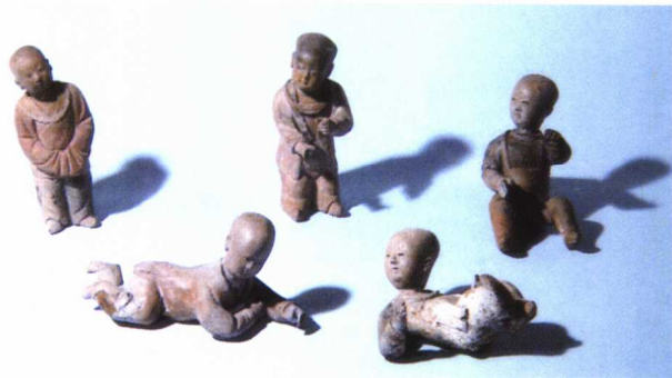
图 1-22 北宋 童嬉捏像

展,出现了官(今河南省开封市)、钧(今河南省禹县)、汝(今河南省临汝县)、定(今河北省曲阳县)、哥(今浙江省龙泉县)五大历史上著名窑系和不同风格的陶瓷产品。公元1004年