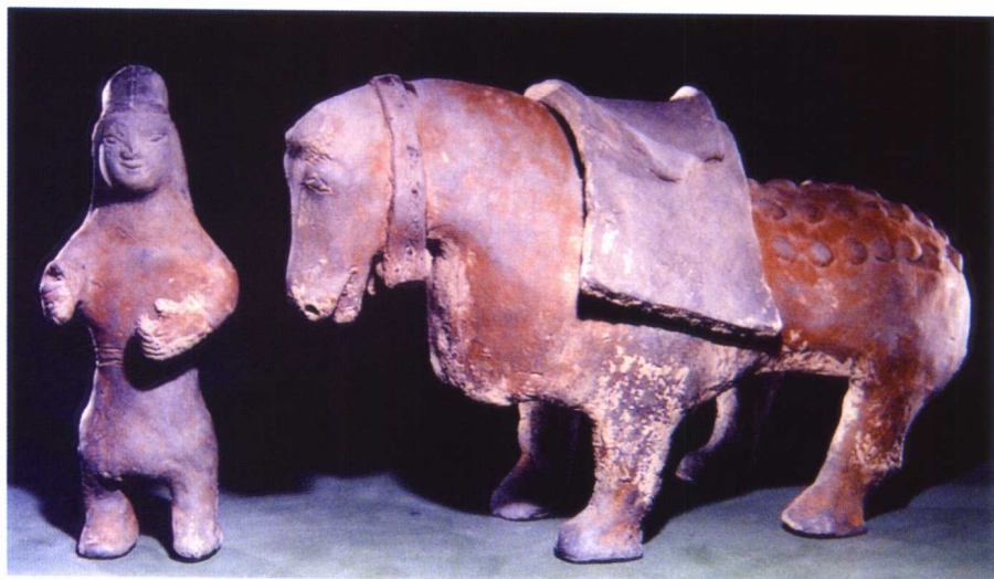
图 1-18 北魏 彩绘陶马及牵马球俑