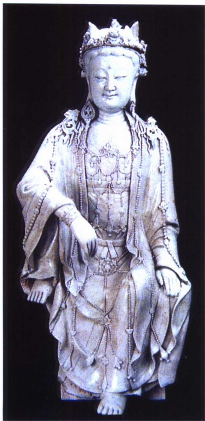
图 1-26 元 景德镇 影青观音