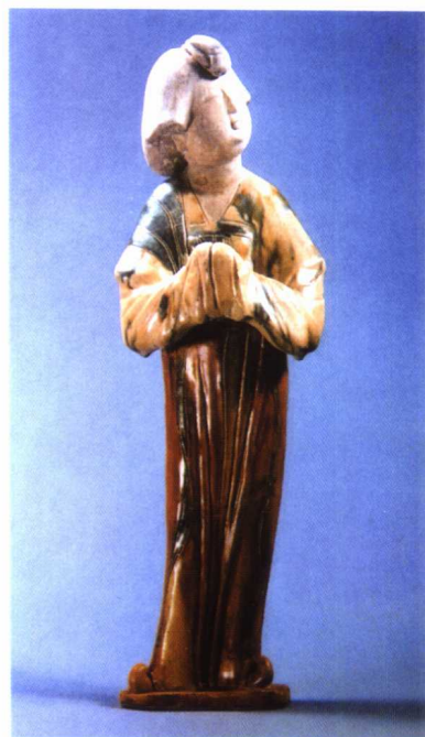
图 1-21 唐三彩侍女

宋代是一个重文轻武的时期,文人画及文人精神的抬升以及理学盛行都直接影响到了人们对陶瓷的审美情趣,同时随着宋代科技水平的提高,其制瓷技术也得到了空前发