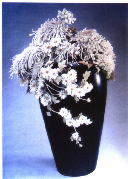
图 1-4 陶瓷捏塑作品