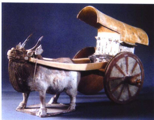
图 1-19 北齐 彩绘陶牛车