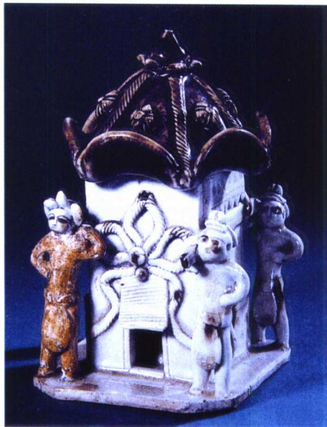
图 1-25 北宋 定窑黑白釉花轿

宋真宗景德年间,朝廷派督陶官来昌南镇监造瓷器,底款皆为“景德年制”,并易名原“昌南镇”为“景德镇”。此时陶瓷雕塑品类丰富,题材广泛,佛像雕塑尤为注重,景德镇还开启了捏、镂和浮雕之先河,影青瓷走向了成熟。(图 1-22、图 1-23、图 1-24、图 1-25)