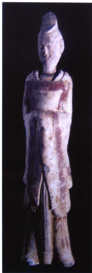
图 1-17 北魏 彩绘陶文吏俑