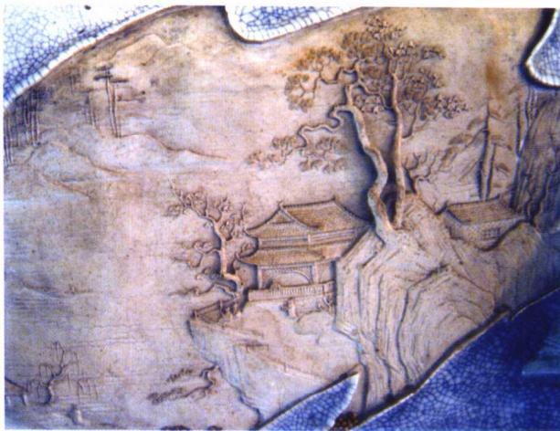
图 1-2 陶瓷浮雕作品