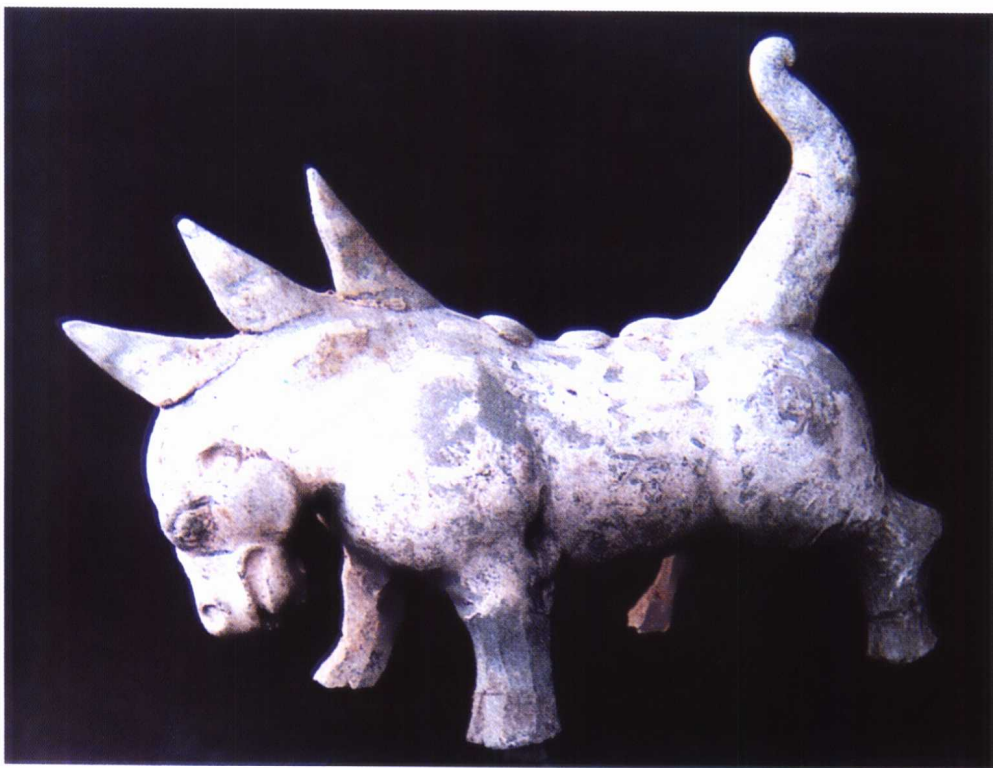
图 1-15 西晋 灰陶兽

俑的发式,甲冑多为少数民族装束。此外,佛教兴盛也直接影响了陶塑。(图 1-15、图 1-16、图 1-17、图 1-18、图 1-19)