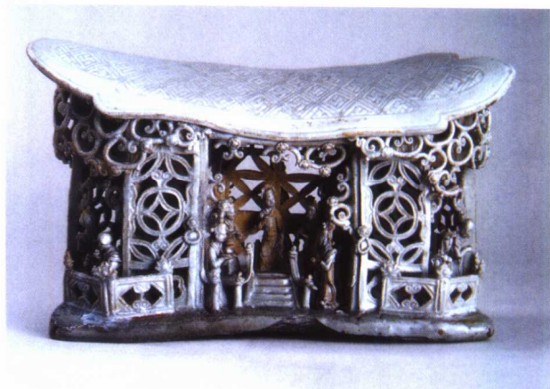
图 1-3 陶瓷镂雕作品