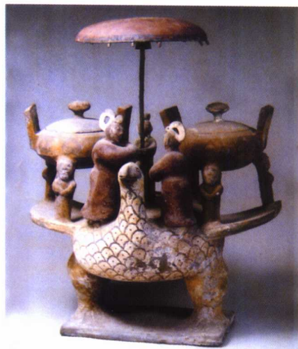
图 1-13 西汉彩绘陶载人鸟

皇陵兵马俑坑，马与将官体形之高大，人物战马比例之精确，烧成工艺技术之精湛，展示出中国古代陶塑艺术已达到令人震撼的程度。汉代时期的制陶业极盛，其陶塑中的说唱、乐舞、杂技俑神态多姿，具有浓厚的生活气息，直接反映出汉代多姿多彩的世间风貌。（图 1-11、图 1-12、图 1-13、图 1-14）