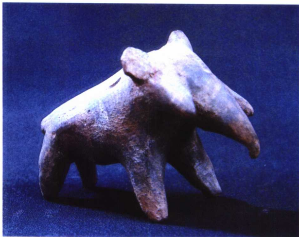
图 1-5 湖北龙山文化象形雕塑

陶器是人类文明的一种载体，与人类生活息息相关，从考古发掘的实物证明，新石器时代的仰韶文化、大汶口文化、马家窑文化、龙山文化中出土的原始陶器中，就有独立的陶塑和依附于器皿之上的雕像，造型方法以泥条盘筑和捏塑成型为主，烧成温度较低，陶质疏松，其颜色主要有红、灰、黑、白等。（图1-5、图1-6、图1-7、图1-8、图1-9）