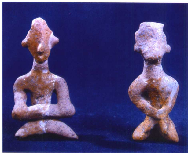
图 1-8 湖北龙山文化人物雕塑