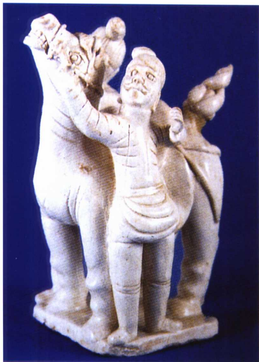
图 1-24 北宋 景德镇窑 影青双人牵马俑