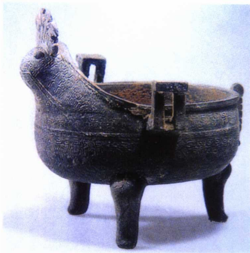
图 1-10 战国原始青釉瓷兽面三足鼎