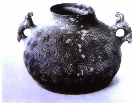
图 1-9 回纹硬陶兽耳瓶

夏、商、周三代主要以青铜工艺为主，在商代已出现了原始青瓷，烧出与青铜器同型而不同质地的原始瓷。其中陶塑的造型就有虎、鱼、羊、龟等。春秋战国的陶塑有小型舞俑、侍女俑等，颇为生动。（图1-10）