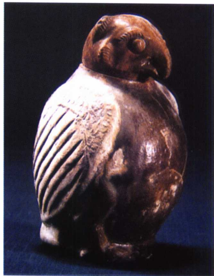
图 1-12 西汉釉陶鸱壶

皇陵兵马俑坑，马与将官体形之高大，人物战马比例之精确，烧成工艺技术之精湛，展示出中国古代陶塑艺术已达到令人震撼的程度。汉代时期的制陶业极盛，其陶塑中的说唱、乐舞、杂技俑神态多姿，具有浓厚的生活气息，直接反映出汉代多姿多彩的世间风貌。（图 1-11、图 1-12、图 1-13、图 1-14）