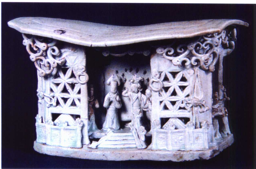
图 1-27 元 景德镇 影青透雕人物枕