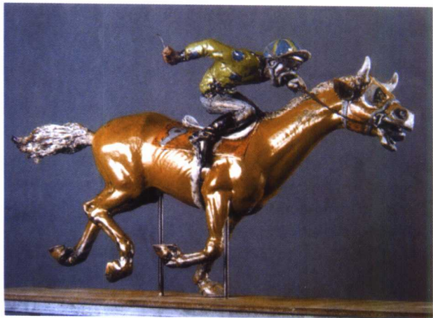
图 1-1 陶瓷圆雕作品