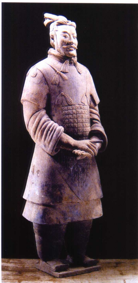
图 1-11 秦兵马俑人物陶像