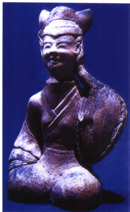
图 1-14 东汉 灰陶听琴俑