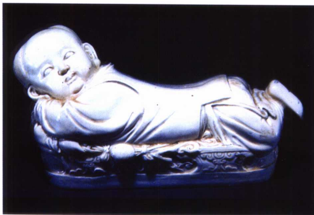
图 1-23 北宋 定窑孩儿枕