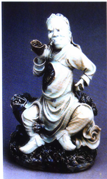
图 1-28 明 景德镇 青花骑兽吹螺人像

泛：神、佛、历史故事、戏剧人物、飞禽走兽都成为瓷塑表达对象。德化窑的人物瓷塑仍保持着精工细雕，质白如玉的风格特色。而此时石湾陶瓷受德化、景德镇瓷雕技艺的影响，陶