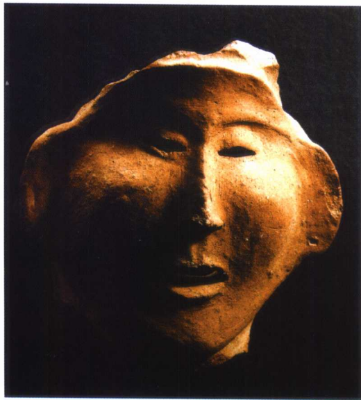
图 1-6 新石器时代仰韶文化彩塑