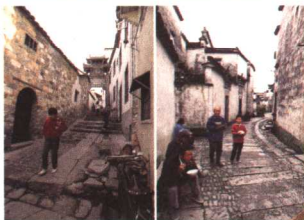
徽州的石板路深幽绵长。人们有时会聚集在街巷上吃饭,交流交流信息,拉拉家常。

马头墙其实是平原的山墙,而在徽州,它的更直接的作用,是为了防火。徽州的村落,动辄上千人家,更有所谓“烟火万家”者,一旦着火,后果不堪设想,所以防火就成为村落建设和民居起造时唯此为大事情。