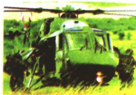
空降师降险，准备配合地面部队作战。