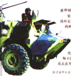
较式装甲车是装甲师必备的中型装备。

装甲师又称坦克师，隶属于集团军或军，主要由主战坦克和坦克兵编成，分为预备装甲师和队属坦克师两种。装甲师是战斗、战役中的重要突击力量。装甲师最早出现于第二次世界大战前，以坦克为主要突击力量，在战斗、战役中进行突击作战。目前，世界上大多数国家的军队都编有装甲师，而且装甲师的武器装备也在逐渐多样化，整体作战能力逐步增强。例如，美军的装甲师不仅配备有辆主战坦克和步兵战车，还配备数十架攻击直升机和侦察直升机，以及数十门自行火炮。