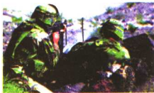
临战的野战集团军

方面军是若干个集团军组成的军队组织，一般隶属于最高统帅部或战区。方面军通常在战时组建，为诸多兵种合成的战略战役兵团，担负着一个或多个方向上的作战任务，并在重点方向上作战时统一指挥、协调作战，共同完成作战任务。