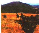
各集团军在统一指挥下协同作战。