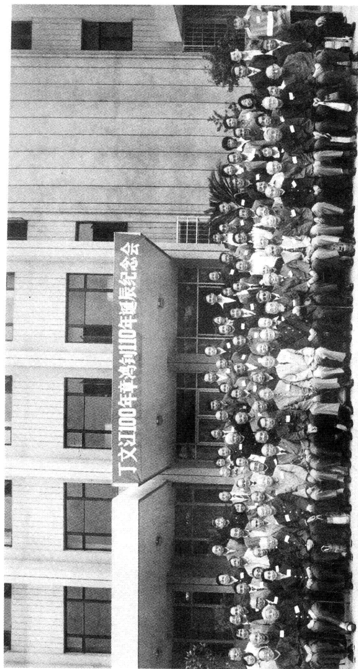
1987年10月5—7日，中国地质学会、北京大学及中国地质学史研究会等单位在北京大学召开的丁文江100周年诞辰纪念会合影。