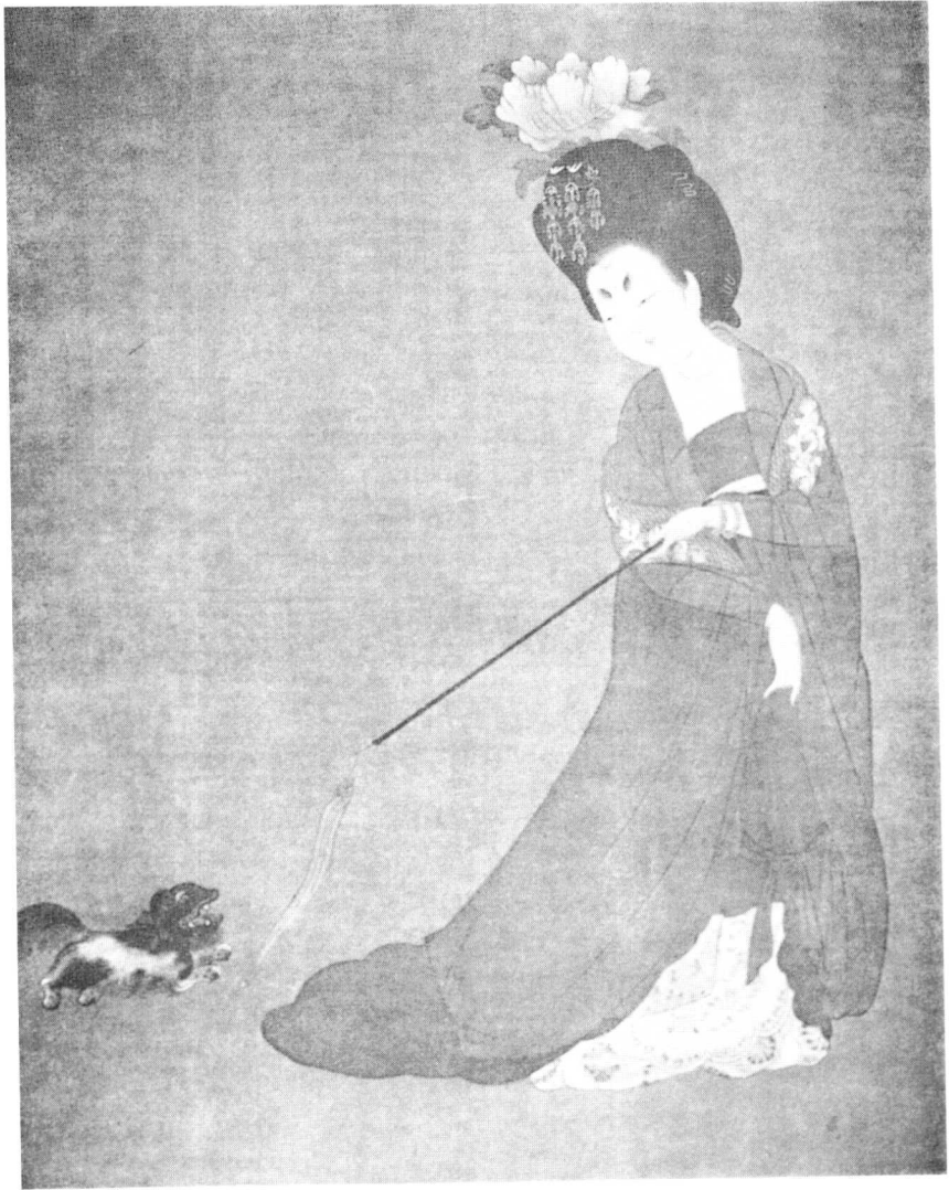
图版7 宫女戏犬（出处同图版6）