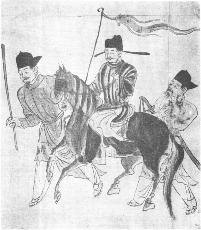
图版8 唐骑马官员像（据日本《佛说十王经》图摹本）