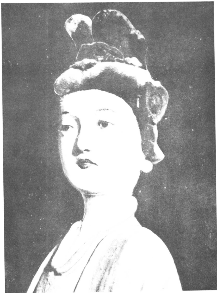
图版 10 山西太原晋祠宋塑女子像（细部，出处同图版 9）