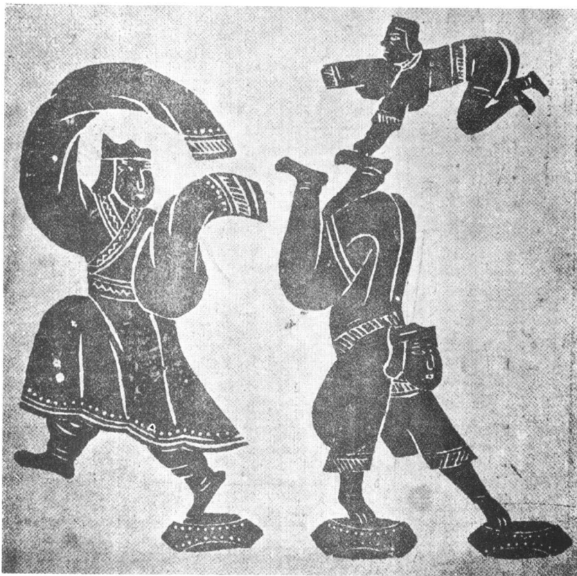
图版2 汉代杂技艺人（汉画像石拓本，木版翻刻）