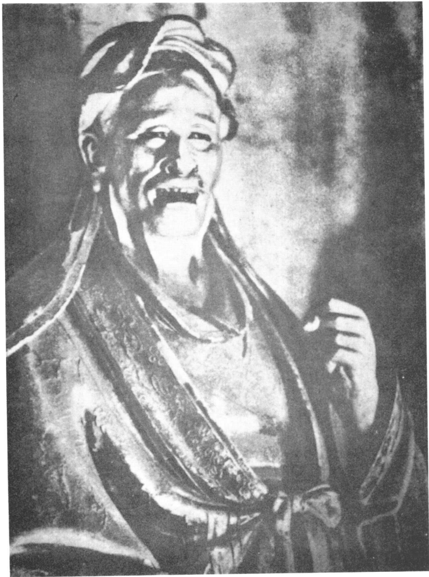
图版9 山西太原晋祠宋塑道士像（细部， 据《中国古代陶塑集》，北京，1955年）