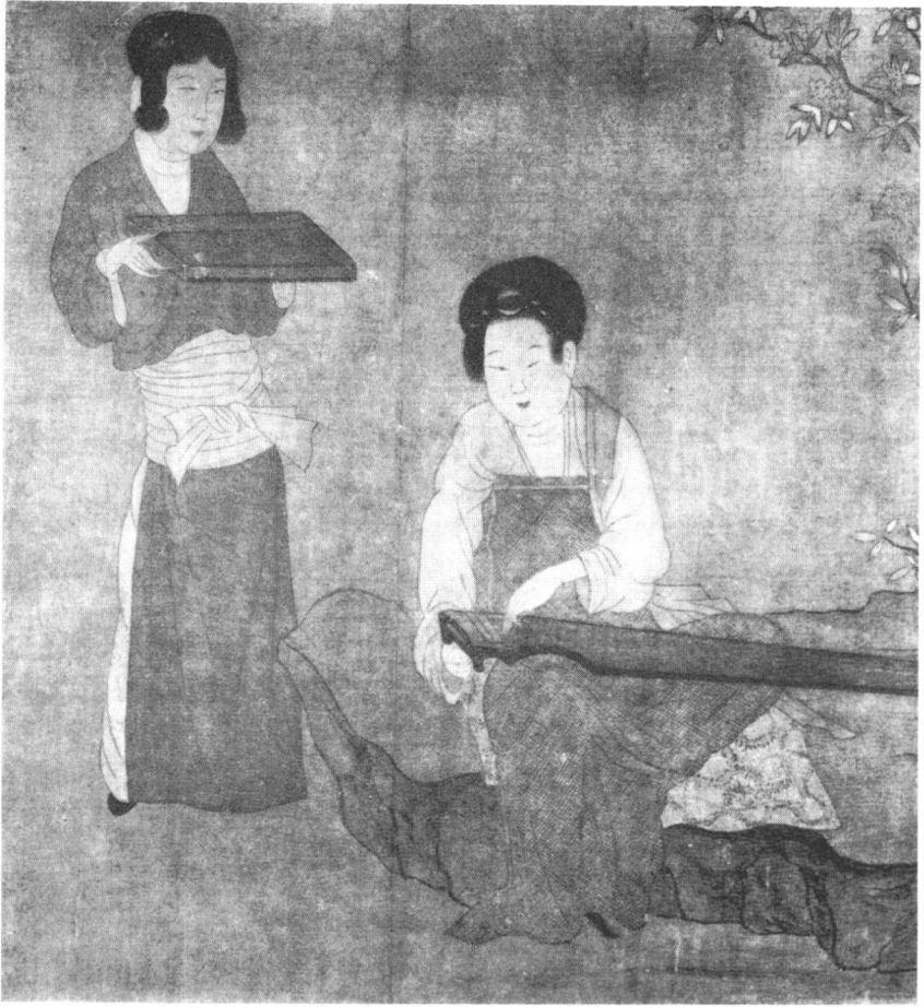
图版6 抚琴的女子（北京故宫博物院藏唐代画家周昉画卷的局部）