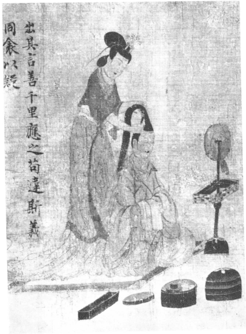
图版3 宫女为帝妃梳头（大英博物馆藏《女史箴图》局部）