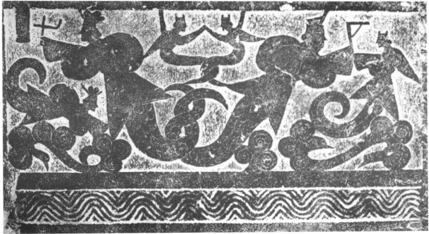
图版1 伏羲女娲（山东武梁祠画像石拓本）