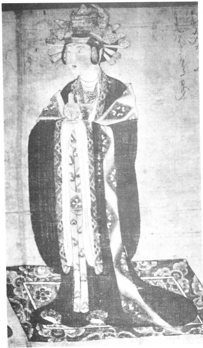
图版 11 公元 983 年的北宋女子（巴黎集美博物馆藏 敦煌壁画，no.17.662 的细部）