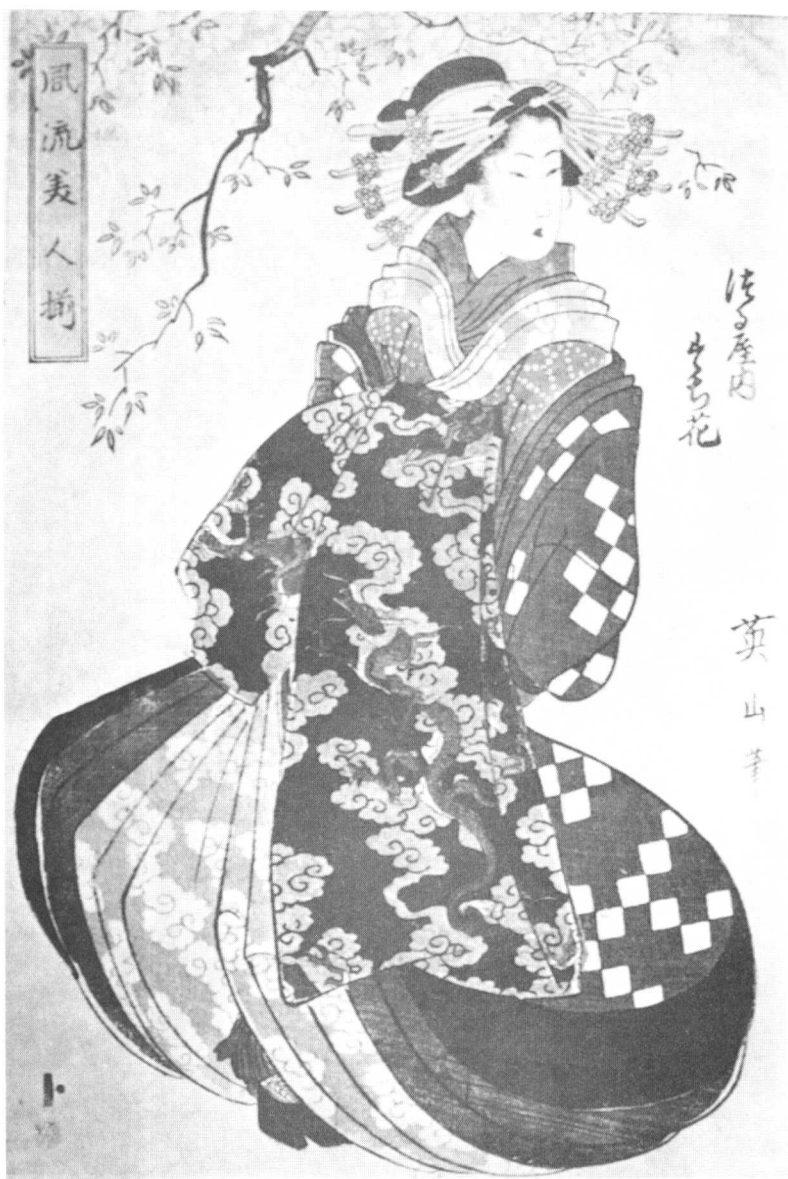
图版 12 日本艺妓（英山彩绘，约作于 1840 年， 荷兰莱顿国家民族博物馆藏品，no.360.4578）