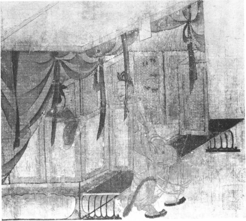
图版4 卧室（《女史箴图》局部）