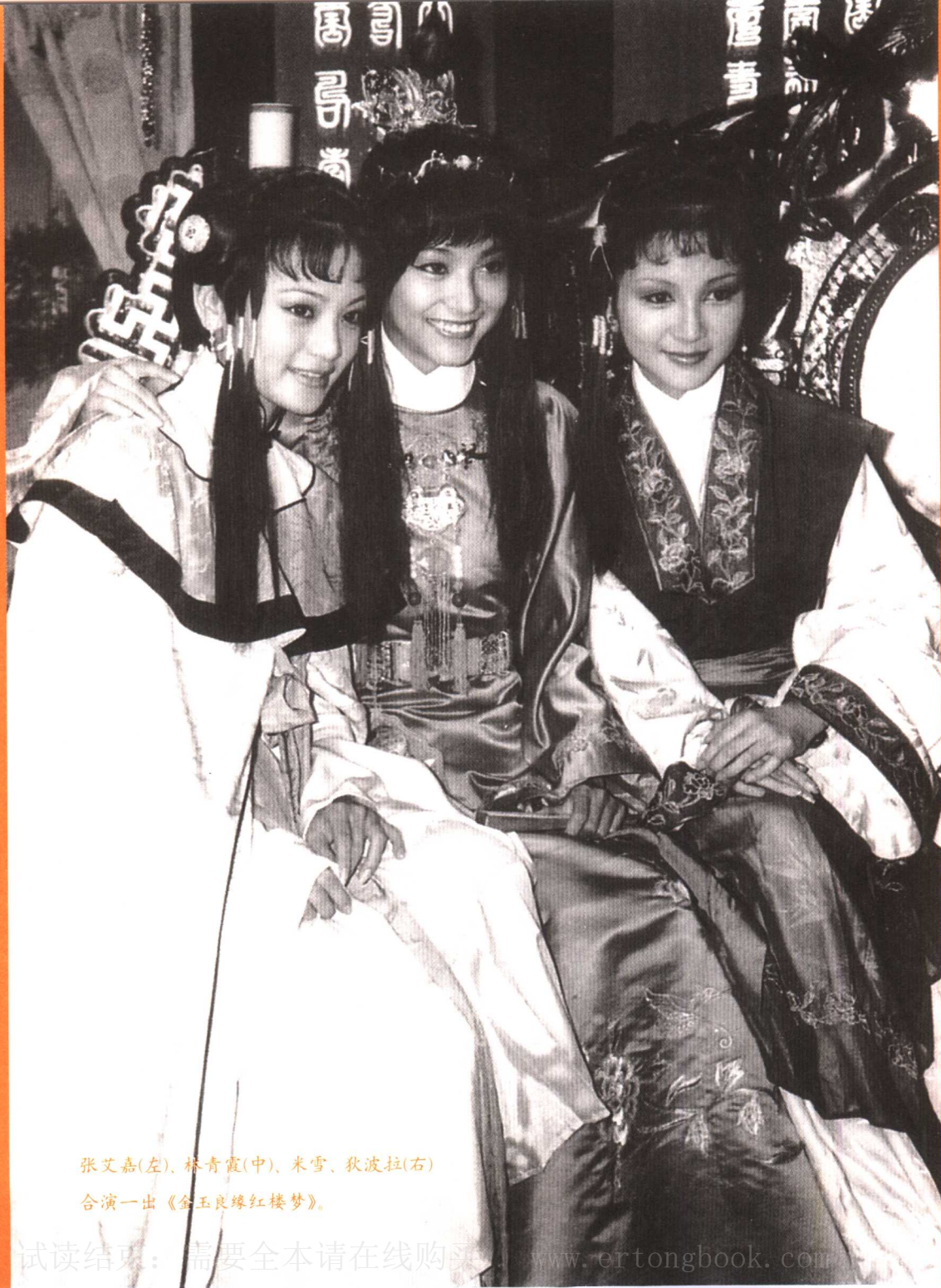
张艾嘉(左)、林青霞(中)、米雪、狄波拉(右) 合演一出《金玉良缘红楼梦》。