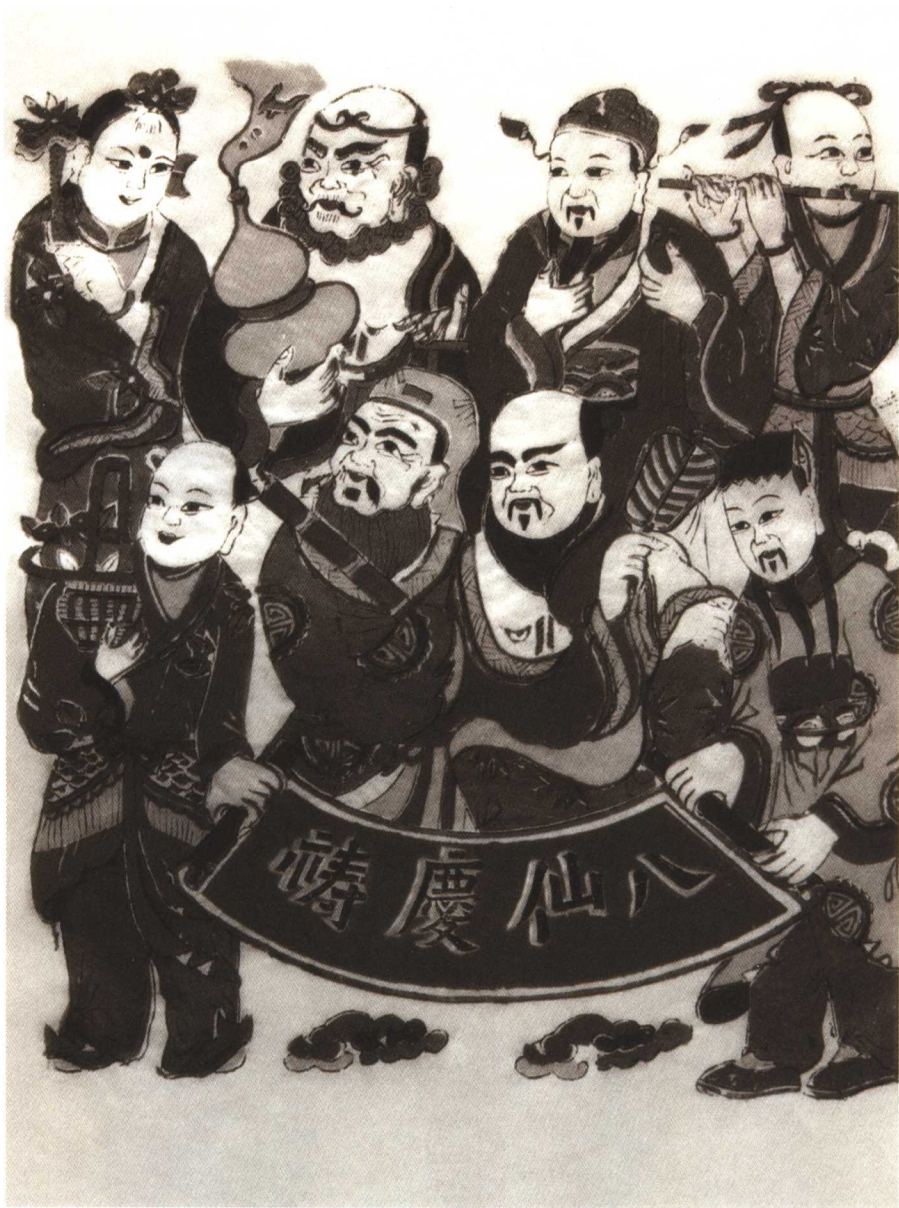
图 12 年画“八仙祝寿”，铁拐李手捧法力无边的道具——葫芦，山东杨家埠。