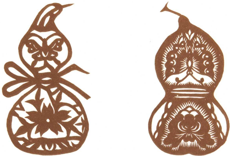
图11 剪纸“葫芦蝴蝶”，山东。