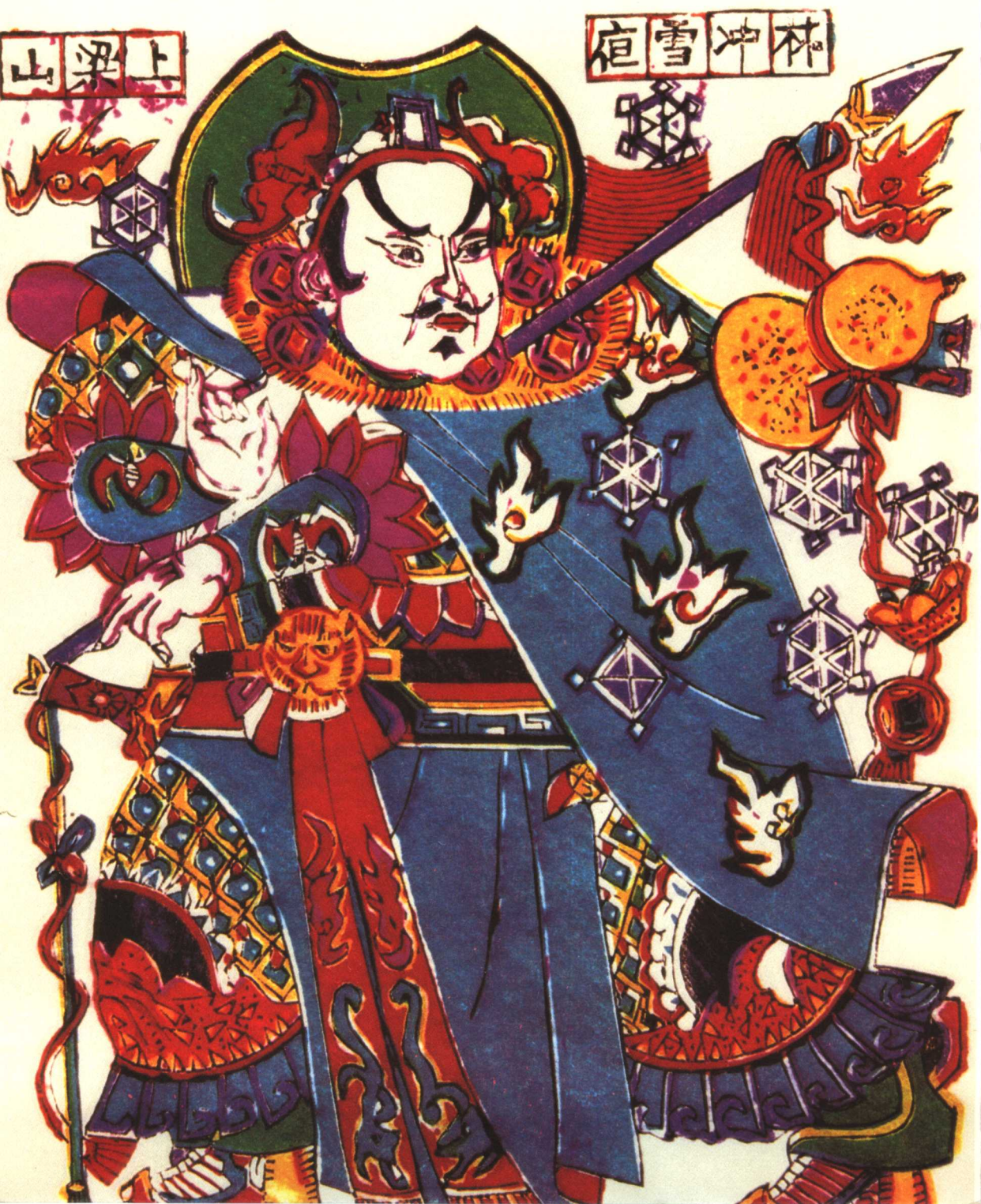
图5 年画《林冲雪夜上梁山》，山东杨家埠。