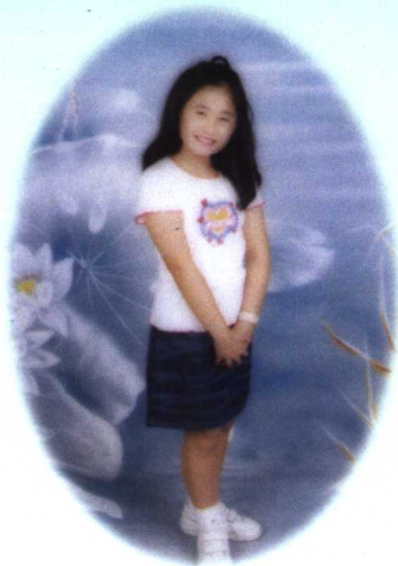
愛就是點燃的星火 熊熊的烈焰 ——《燃燒的愛》