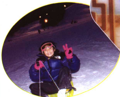
二〇〇一年十二月在日本滑雪