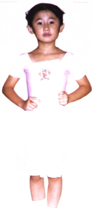
一九九九年考取『英國皇家舞蹈學院』芭蕾舞證書時留影

我張開五指 在琴鍵上跳動 一串串 精靈的音樂 便在空中飄蕩 好像一群群 美麗的仙子 圍着我團團 起舞