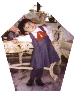
一九九五年上耀中幼兒園