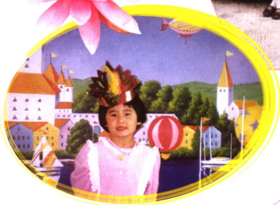
一九九八年四月在香港太平山