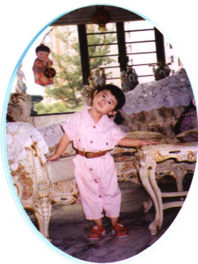
一九九五年七月在家中