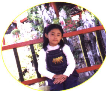
二〇〇〇年攝於香港海洋公園