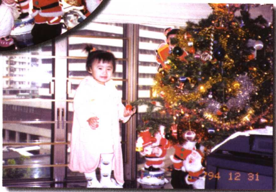
一九九四年聖誕影於家中