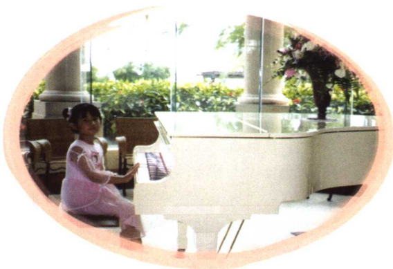
一九九九年六月在黃金海岸