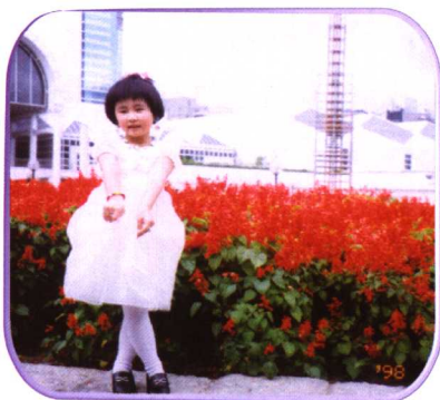
一九九八年四月在九龍公園