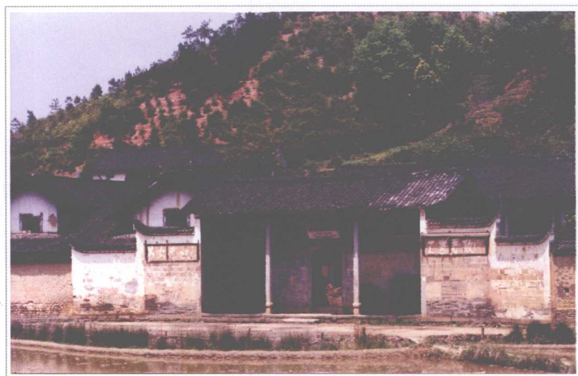
▲ 湖南省苏维埃政府办公旧址——大围山镇锦绶堂