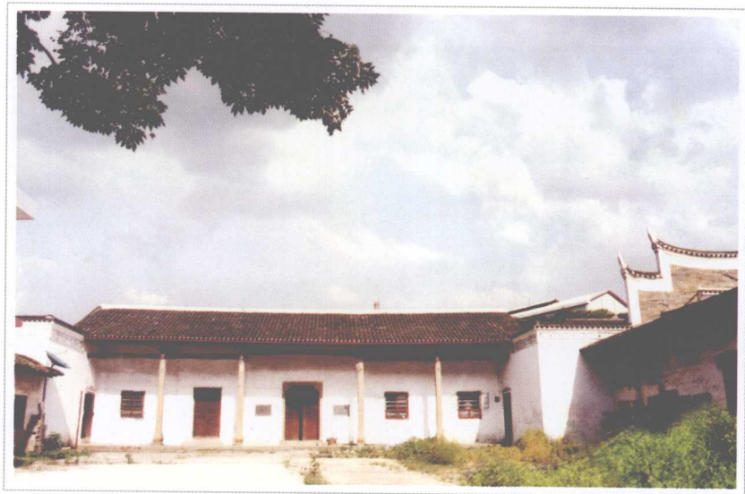
▲ 红一方面军成立旧址——永和镇李家大屋