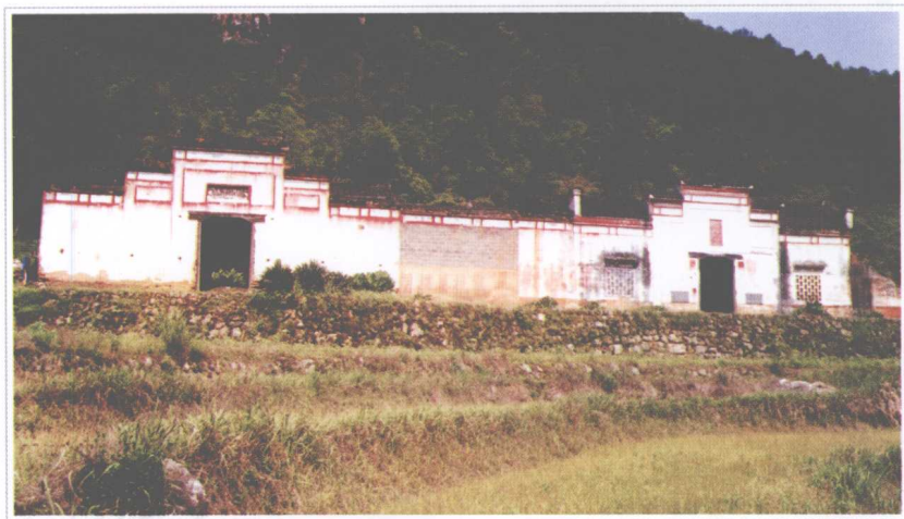
▲ 浏阳县第一次工农兵代表大会会址——七宝山乡狮山庙