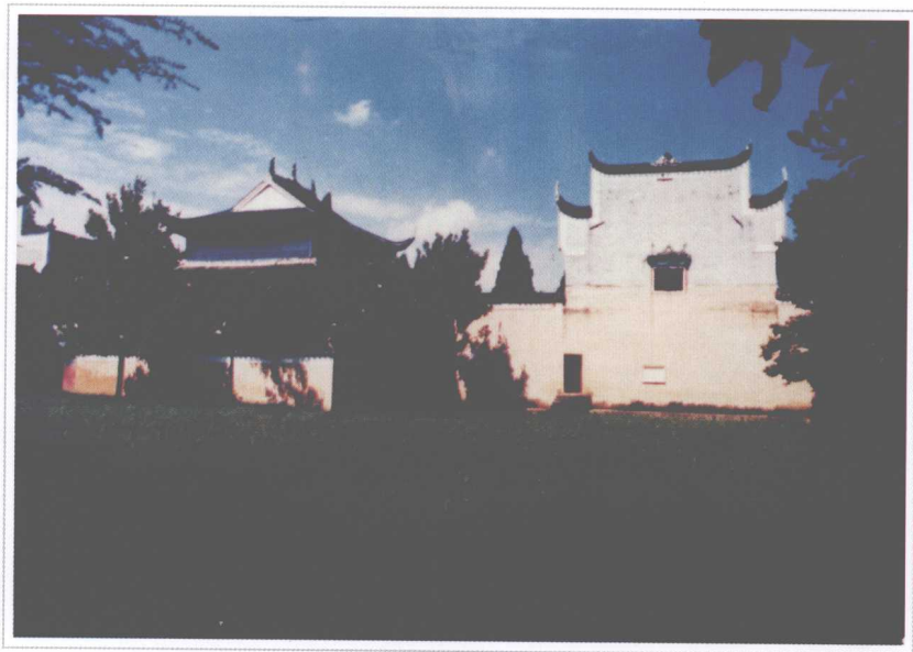
▲ 湘赣边界秋收起义文家市会师旧址——里仁学校操场