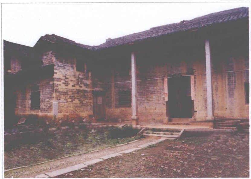
▲ 中共湘鄂赣省第一次代表大会会址——大围山镇楚东山