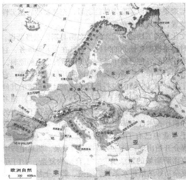
图 1-2 9~11 世纪欧洲地图

即希伦人居住的地方。古代希腊，包括希腊半岛、爱琴海诸岛和小亚细亚西部海岸。希腊半岛是古希腊的主要领域，东临爱琴海，西接爱奥尼亚海，整个半岛山脉纵横，五分之四是山地，土地贫瘠，河谷里的小块土地是唯一适合耕种的地方，荒凉的山坡把平原分割成块，使得陆路交通极其不便，近海连鱼都不产，人们面对的环境十分恶劣。尽管如此，那里旧石器时代就有人居住，公元前 3000 年克里特岛进入青铜时代，公元前 2000 年左右建立了城邦国家，公元前 1500 年出现了迈锡尼文明。由于地少人多的矛盾，公元前 11 世纪开始，半岛上的居民大规模地向外移民，足迹遍及爱琴海地区，开始了真正意义上的希腊文明（如图 1-2 所示）。