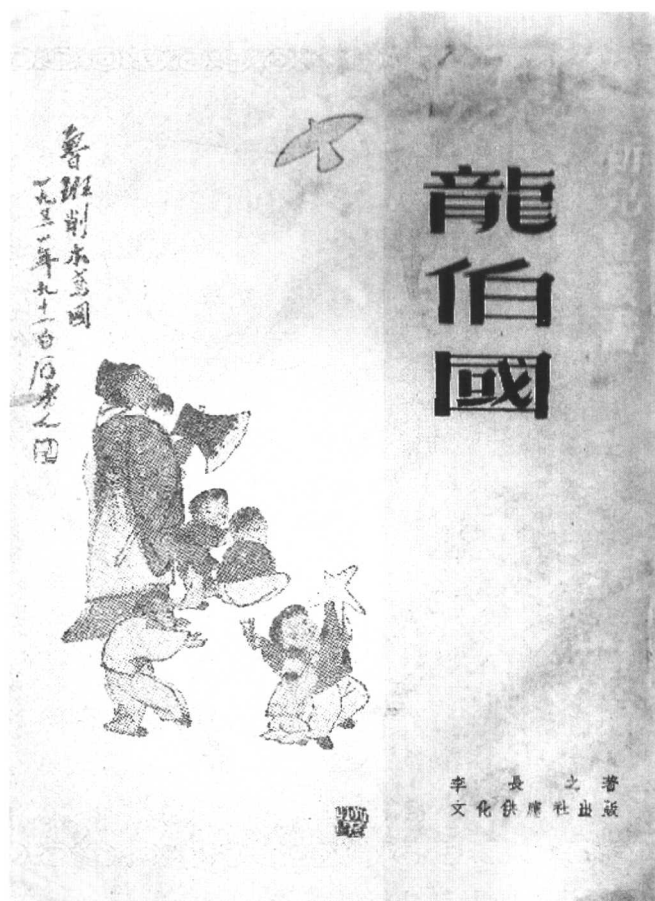
◎ 《龙伯国》封面 文化供应出版社版