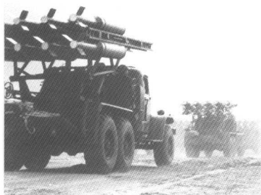
火箭布雷车奔赴发射地域