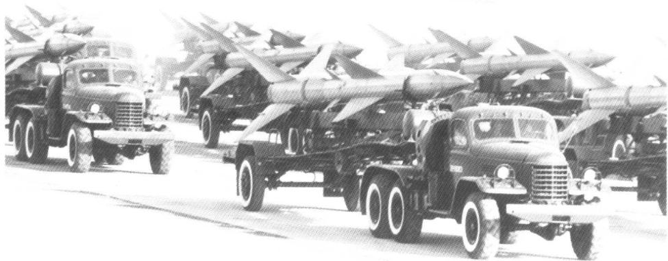
地空导弹方队通过主席台接受检阅