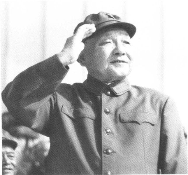
邓小平、胡耀邦等党和国家领导人在华北军事演习阅兵主席台上检阅部队