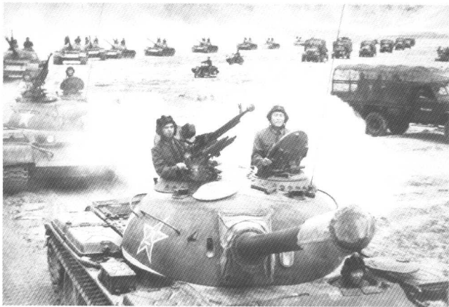
激战中“红军”二梯队加入战斗