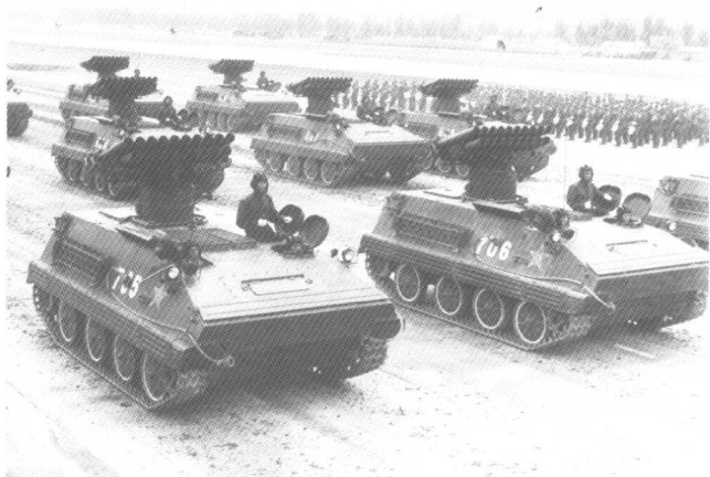
自行火炮方队接受检阅通过主席台