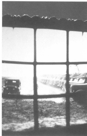
野营帐篷城