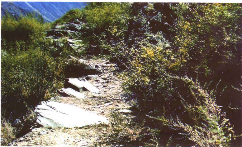
古道茶马两茫茫，“此行兼为谒穹苍”。