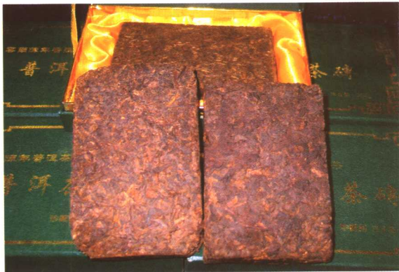
云南陈年普洱茶砖

茶马古道的核心问题是“茶”，只有茶叶才是这条古道的中心。青藏高原的藏族人民最需要茶叶，而离它最近的茶叶产地是云南和四川。因此，茶马古道就是由云南和四川至西藏的茶叶运输线，也是亚洲大陆以茶叶为纽带的贸易古道。藏族人民最喜爱的茶叶是云南思茅的普洱茶和大理的沱茶，其次是四川雅安的雅茶。雅安附近的邛崃、名山、天全、荃经等地都盛产茶叶，有名的蒙山茶从西汉就开始生产，蒙山至今还有西汉茶树，距今