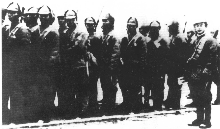
1938年2月，鄂豫皖边和鄂豫边红军游击队正式改编为新四军第4支队。图为东进中的第4支队一部。