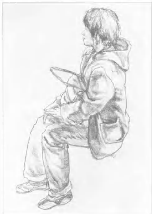
图14 作者: 郭志