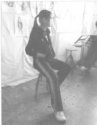
图19 人物模特儿 持几架 景照片

在画速写时先了解动态目的，观察动态的过程，选择生动的瞬间和恰当的角度，确定作画位置。速写主要是考查我们的观察能力和概括能力，在作画前一定要观察到要把握的重点，概括出大的基本形和动态，意在笔先，胸有成竹。在理解时，一定往最简单处理解，大胆舍弃，大胆联想，大胆落笔（如图19）。