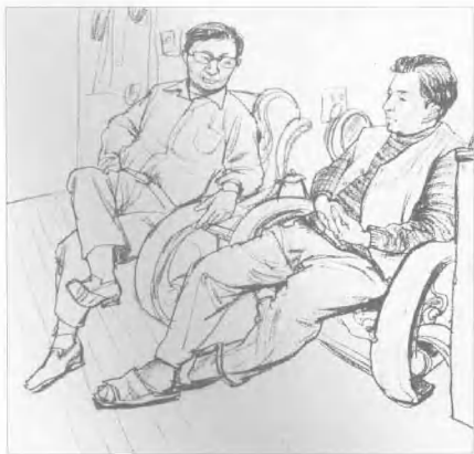
图5 作者: 郑晓峰