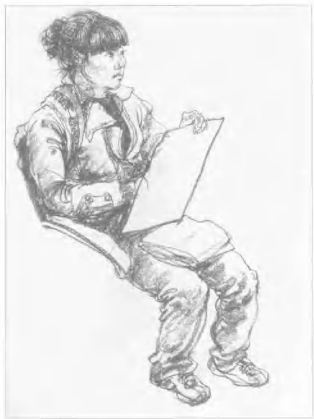
图13 作者: 孙颖