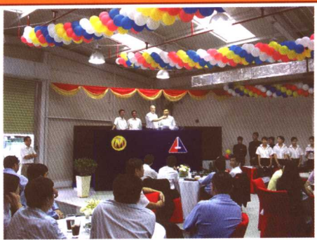
▲美中拍卖师首次切磋技艺