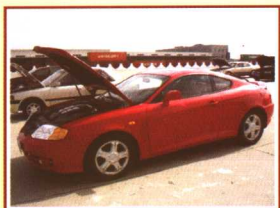
停车场内停满了待拍的二手车。