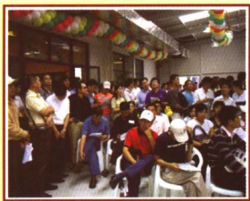
首场拍卖会人真多啊！