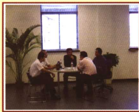
稍歇片刻，养足精神参加竞买。