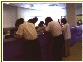
出示身份证明办理竞买手续。