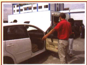
这辆车不错，我来试试车！