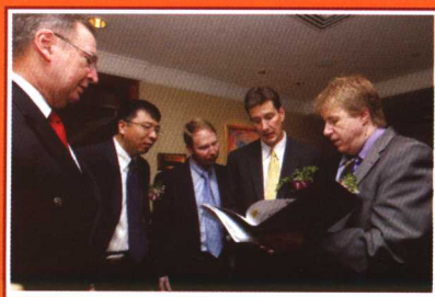
▲美瀚公司美方代表在新闻发布会上交流商讨。