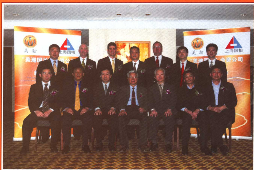
▲汽车协会、拍卖行业及美瀚国拍机动车有限公司领导工作人员集体合影

中国首家中外合资二手车拍卖机构——上海美瀚国拍机动车拍卖有限公司于2006年4月19日在上海成立，并于9月19日正式在上海营业。美瀚携手国拍代表了一个双赢的合作，融合了美瀚先进的拍卖技术、卓越的营运能力、丰富的管理经验，同时结合了上海国拍具有的市场领先优势，将进一步拓展国内其他省市的业务。