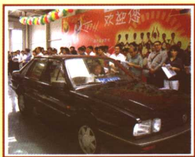
车子缓缓开进拍卖会场。