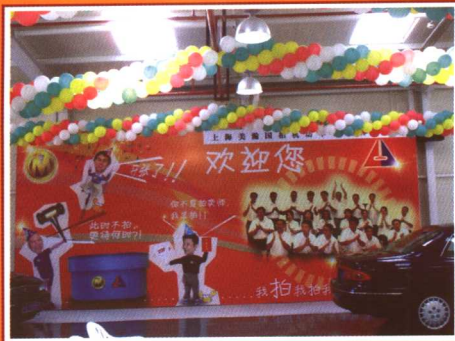
▲欢迎参加客户招待会