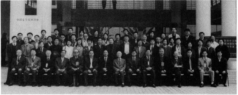
2003年12月出席中国散文与 中华民族精神国际学术研讨会 (前排右六为作者)