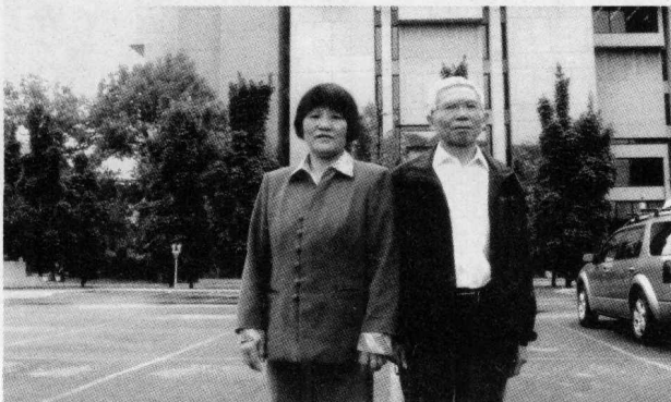
2007年8月与年英在渥太华大学