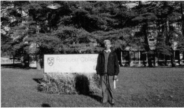
2007年参观加拿大滑铁卢大学孔子学院