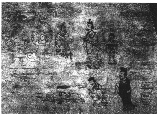
东汉壁画《祝寿升仙图》

更始元年(23)九月,更始军队一连攻克长安和洛阳。刘玄打算以洛阳为国都,命令刘秀先行修整洛阳宫殿、官府。刘秀“安排僚属,下达文书”,很快就将混乱不堪的洛阳城恢复了以往的平静。刘秀还依照汉朝旧历来安排官制和官服。一切安排就绪,刘玄高高兴兴地选了个黄道吉日,在那天全体“迁都”洛阳。对于曾经历了西汉和新莽朝的大臣们而言,他们当然希望看到刘氏王朝的复兴,纷纷从长安城赶往洛阳朝见,其中有长安城京兆尹、左冯翊、右扶风等人。可当他们抵达洛阳后,却被帝座上更始皇帝和那些亲信大臣们不伦不类的装束