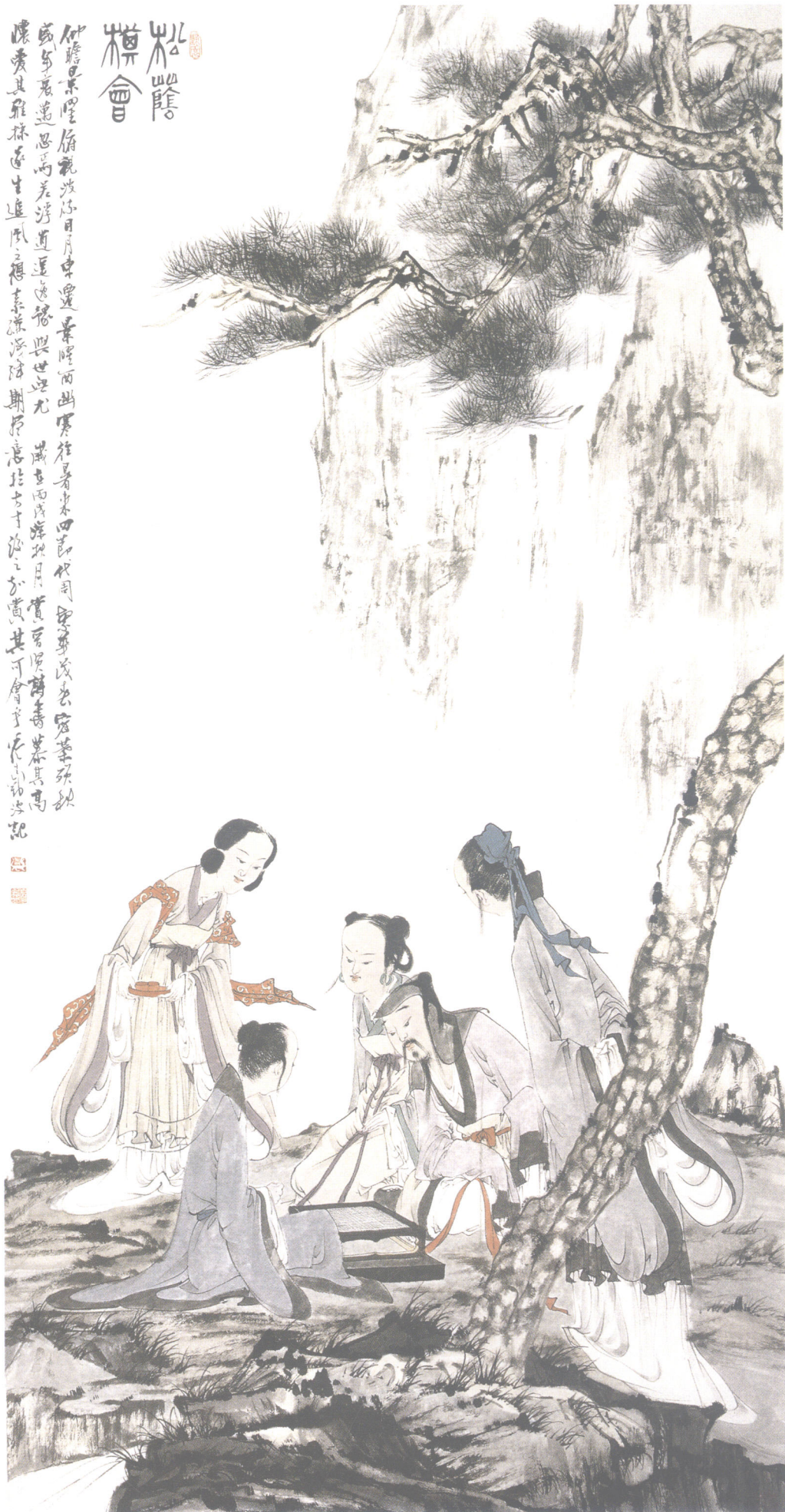
松阴棋会 2006年 176cm x 90.6cm 纸本