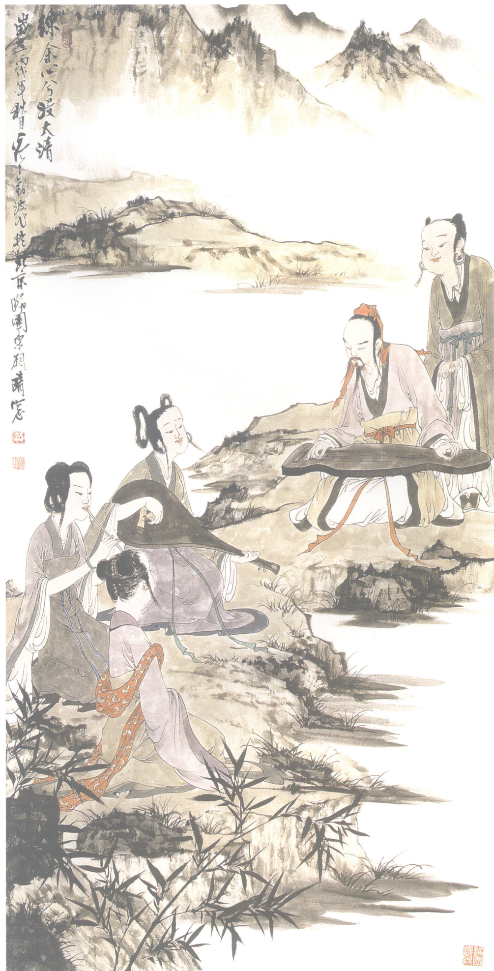
练余心兮浸太清 2006年 136.5cm × 68.5cm 纸本