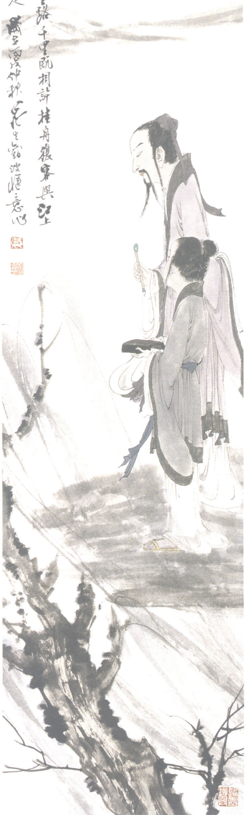
晋贤高致（三、四） 2006年 136.5cm × 34.2cm × 2 纸本

灑子渡桂舟時同千里路千里既相許桂舟復與與 可憐羨清歌亦南楚 歲在丙申仲秋之月 子行 畫於秋夜忘寫