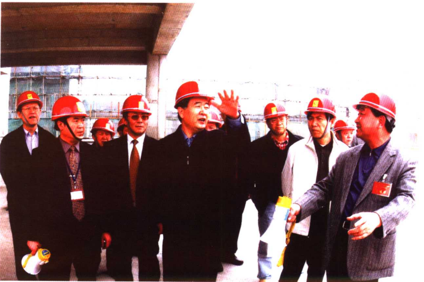
2006年3月于重庆，前排中为重庆市委书记、市人大常委会主任汪洋，后排左1为作者。