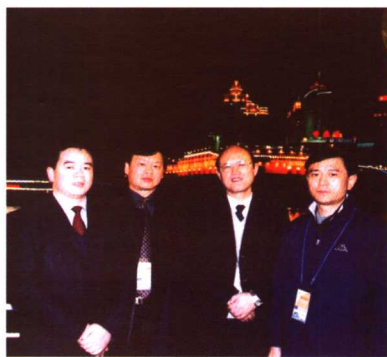
2002年9月于重庆，左2为信息产业部副部长娄勤俭。