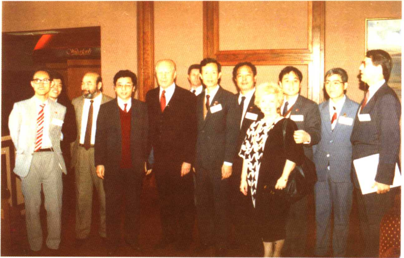
1987年11月于美国，左5为美国前总统福特，左1为作者。