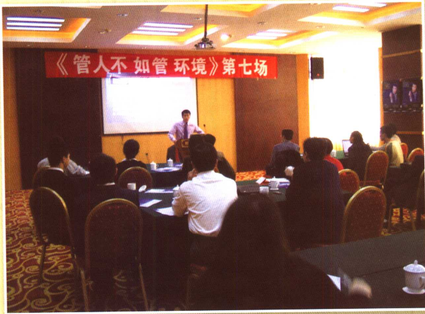
“管人不如管环境”巡回培训会（3）