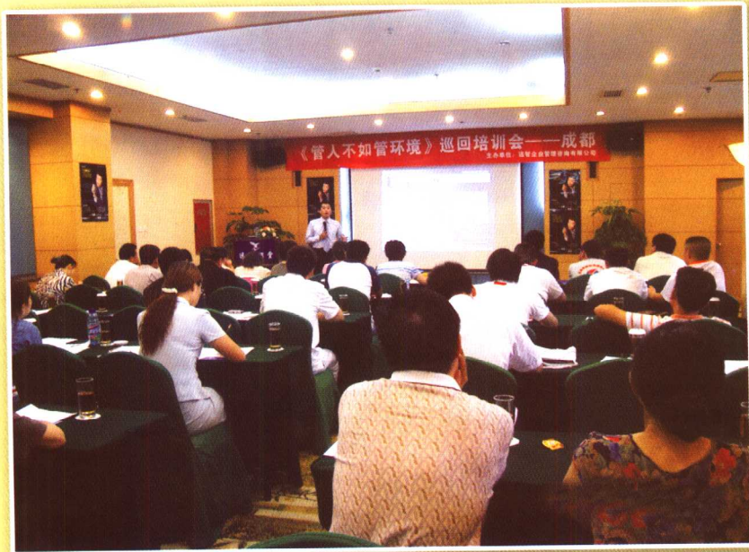
“管人不如管环境”巡回培训会（4）