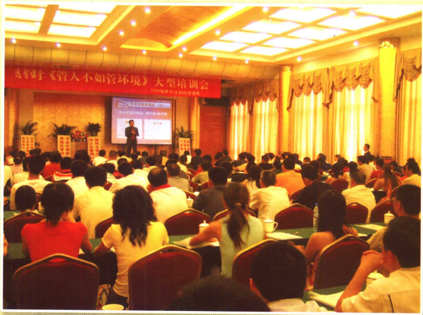
“管人不如管环境”巡回培训会（1）