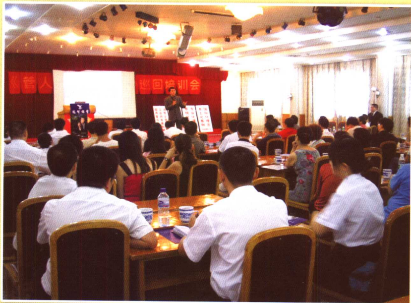
“管人不如管环境”巡回培训会（2）