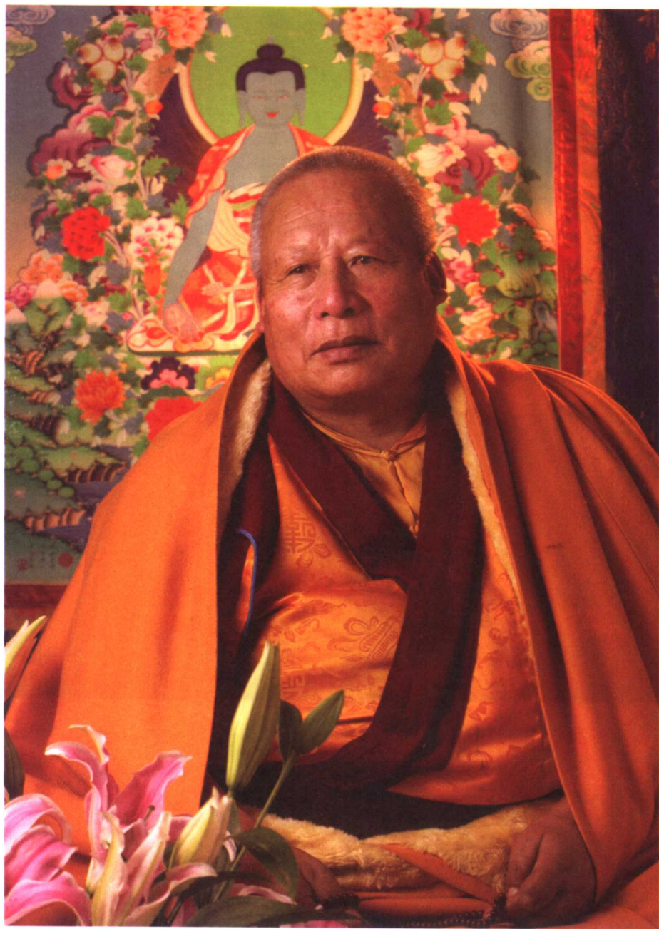
丹贝旺旭仁波切法相