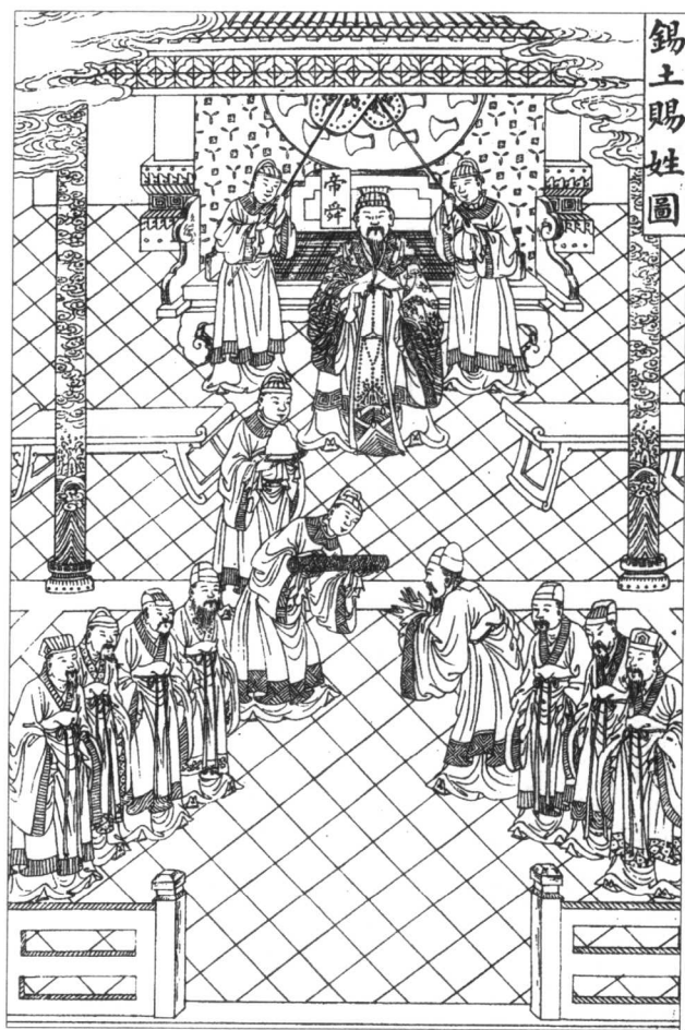
◎ 朝会上官员站立的位置不能出错。

朝会的时间，根据议程多少有长有短，一般多在辰时（午前七至九时，这里多指九时）结束，称“散朝”、“放班”或“退朝”。五代以后，常有这样的情况：早朝时，皇帝并不上殿与百官见面，而是将宰相或首辅等一些重臣召入内殿开小会。小会开完后，宰相出来，领着百官在殿廷行礼后，宣布退朝。《梦溪笔谈》记载，宋神宗即位之初，韩琦任宰相，遇到小会时间过长，便照过去的习惯，让其他官员自行退朝。王陶任御史中丞后，为此弹劾韩琦。皇帝因此下令，如遇执政大臣奏事到辰时还未结束，“即一面放班”，就是允许百官自己退朝，以后便定为制度。