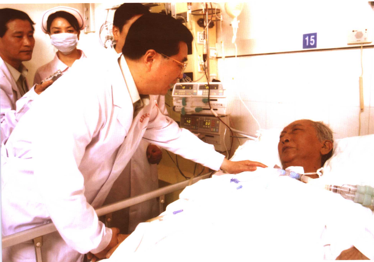
2006年7月21日，中共中央总书记、国家主席、中央军委主席胡锦涛来到北京军区总医院，看望病中的华益慰