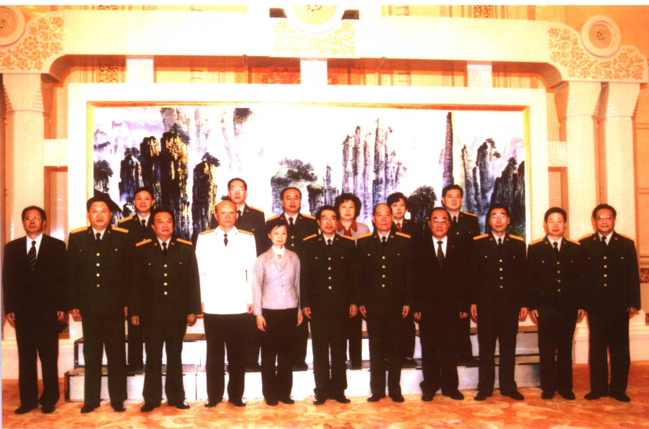
2006年7月25日，受胡锦涛主席委托，中共中央书记处书记、中央军委副主席徐才厚接见了“华益慰先进事迹报告团”成员。中央军委委员、总政治部主任李继耐参加会见