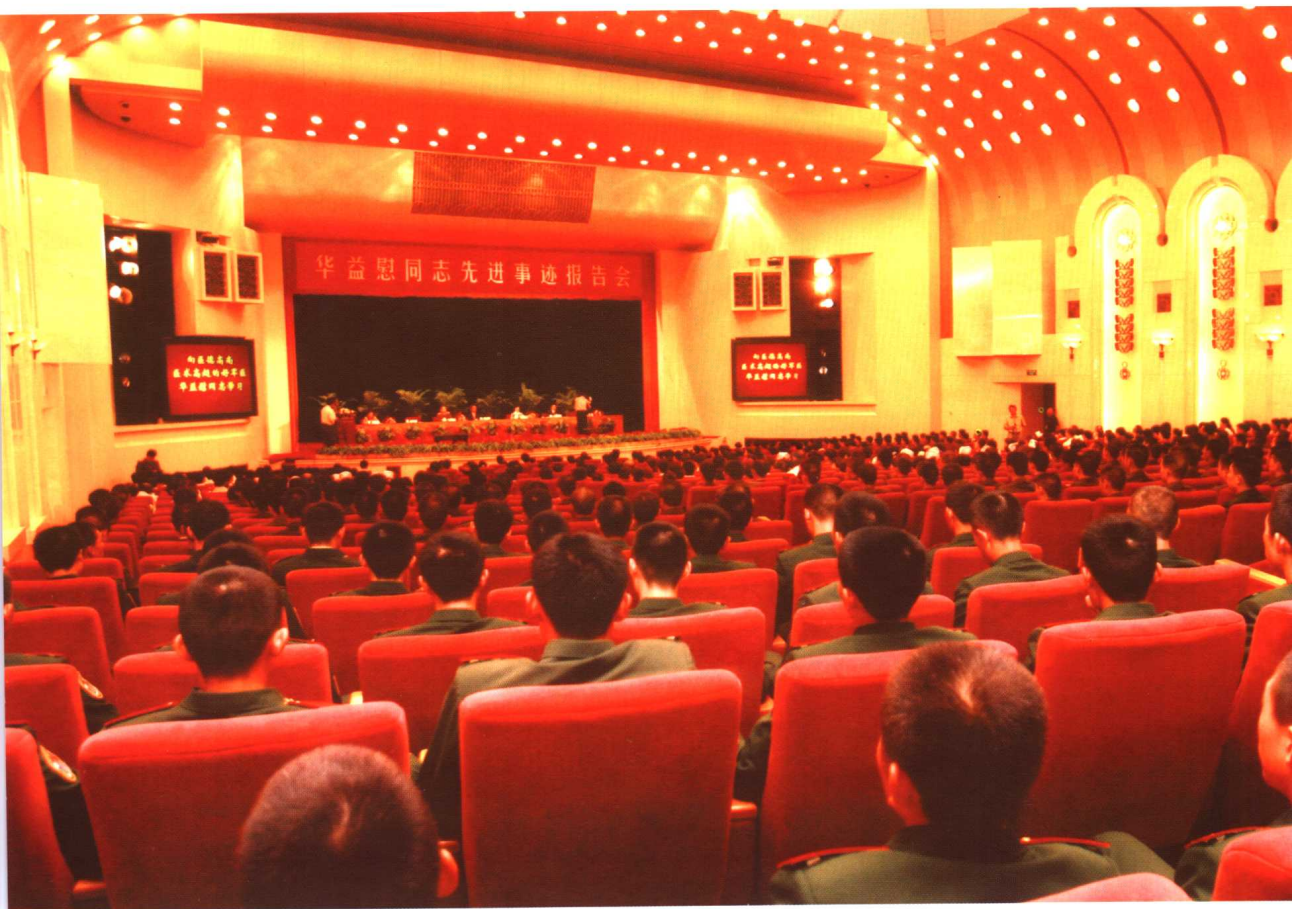
2006年7月25日，华益恩同志先进事迹报告会在人民大会堂举行