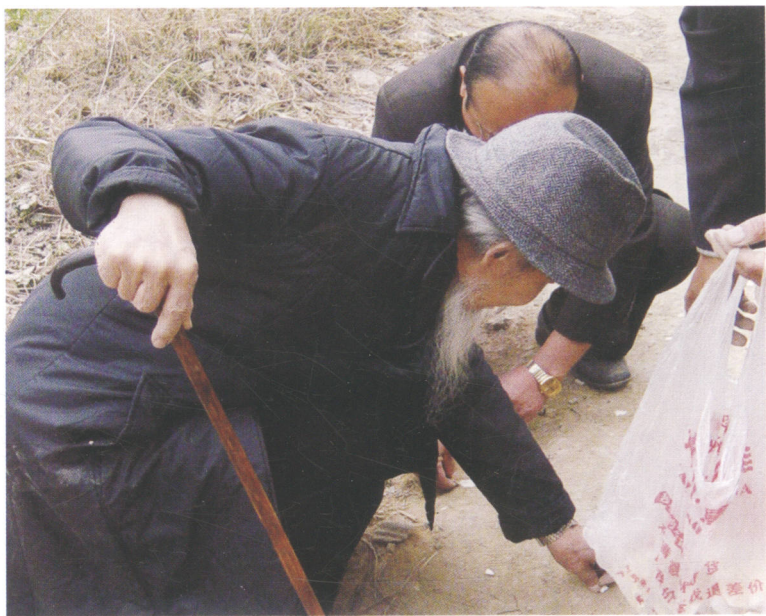
2006年11月15日研讨会与会专家在当阳峪古窑遗址现场研究 地面残留瓷片