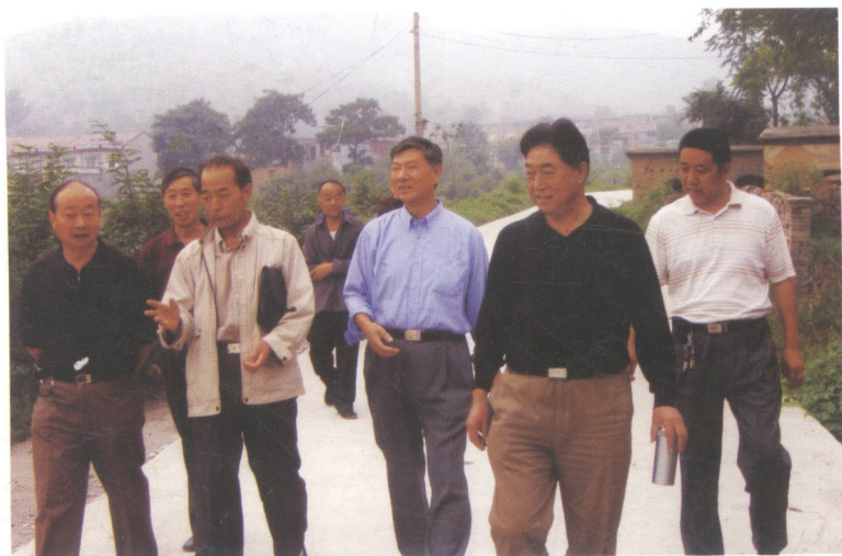
2006年7月8日焦作市政协学习和文史资料委员会领导在当阳峪村支部书记和有关村民陪同下，实地考察当阳峪古瓷窑遗址现场