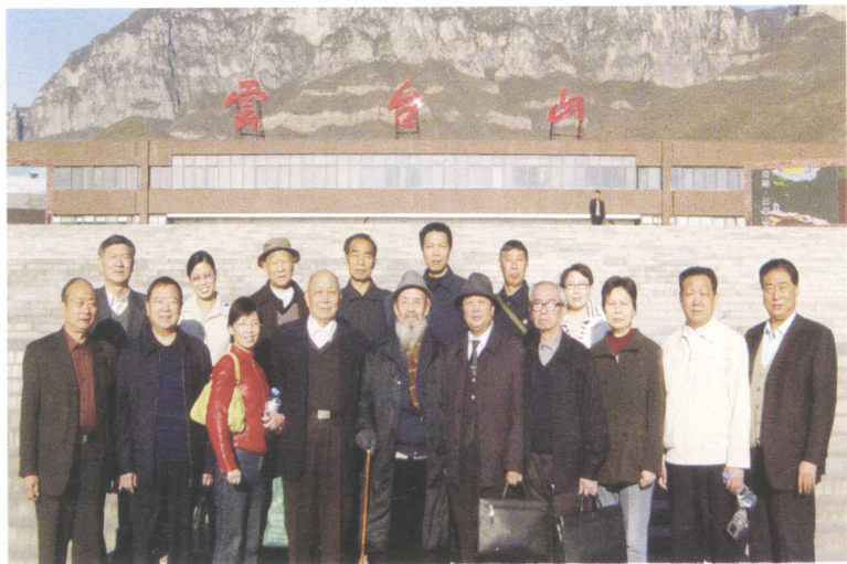
2006年11月15日陶瓷研讨会贵宾参观云台山景区合影留念