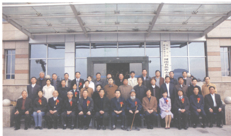
2006年11月14日“焦作市政协陶瓷研讨会”全体人员在政协办公楼前合影留念