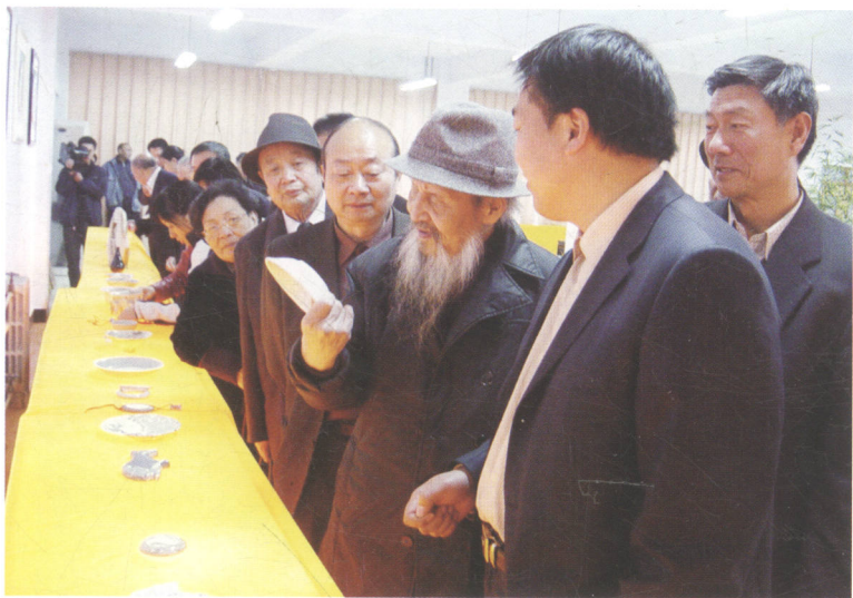
2006年11月15日焦作市政协陶瓷研讨会与会专家参观焦作金谷轩绞胎瓷公司艺术陶瓷展