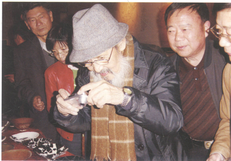
2006年11月14日研讨会与会专家在市博物馆参观焦作古陶瓷精品展