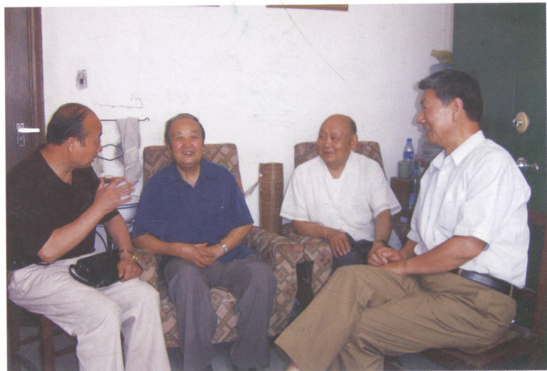
焦作市政协陶瓷研讨会受到省文物考古研究所的重视和支持。图为2006年8月6日焦作政协有关同志到郑向有关专家汇报研讨会筹备情况。