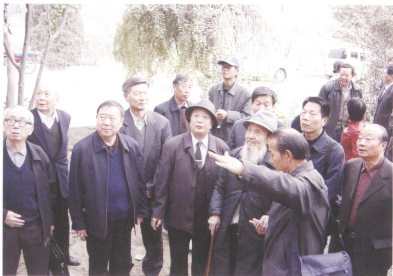
2006年11月15日研讨会与会专家在当阳峪村古瓷窑发掘地实地考察