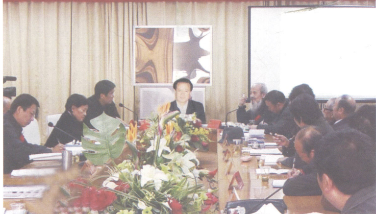
焦作市政协主席赵功佩同志（居中）于2006年11月14日在陶瓷研讨会开幕式上致词