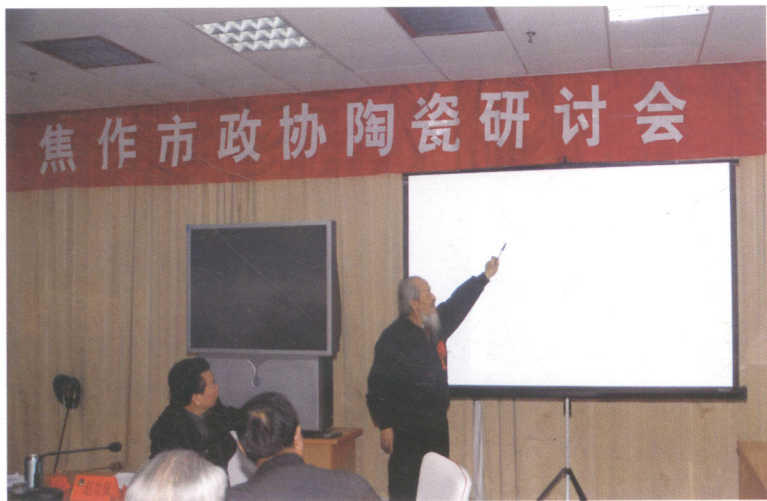
2006年11月14日清华大学教授叶喆民在研讨会上演讲