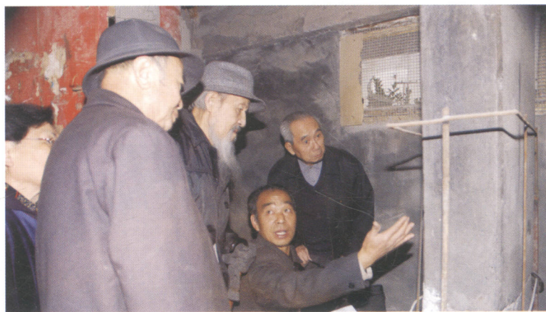
2006年11月15日研讨会与会专家参观当阳峪村庙神碑