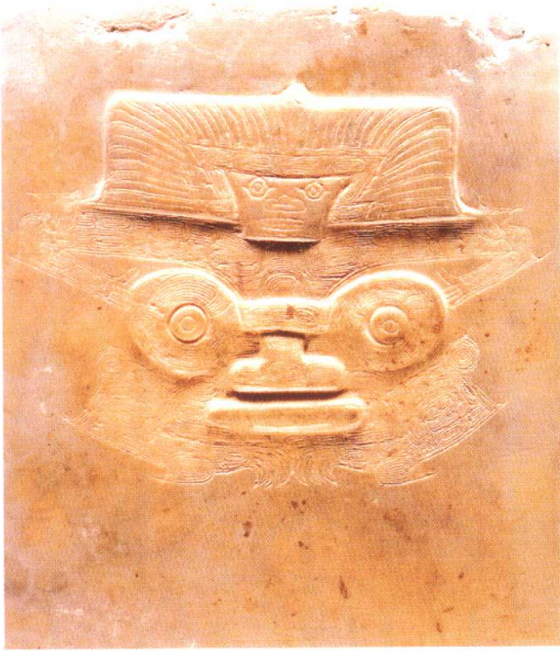
良渚文化玉琮上的太一神徽