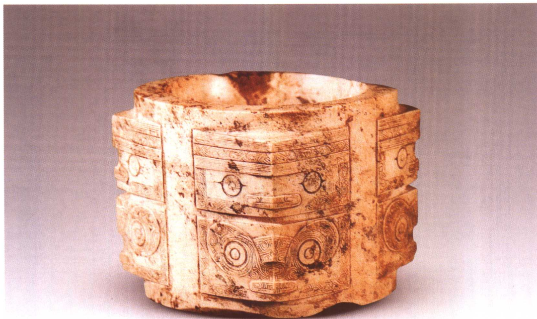
良渚玉琮 江苏武进寺墩出土