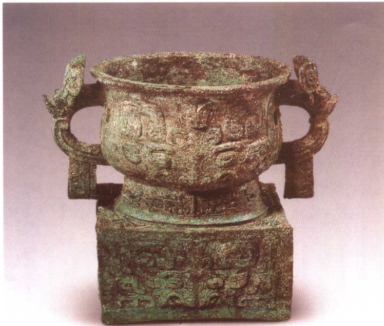
利簋 西周早期 陕西宝鸡戴家湾出土