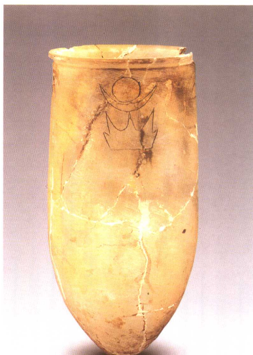
大汶口文化刻符陶尊