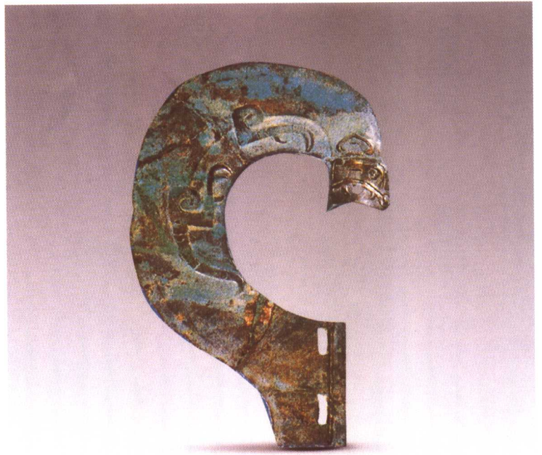
虎纹半环形钺 甘肃灵台白草坡出土