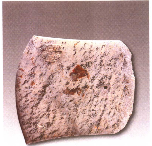
良渚玉钺 浙江余杭反山出土