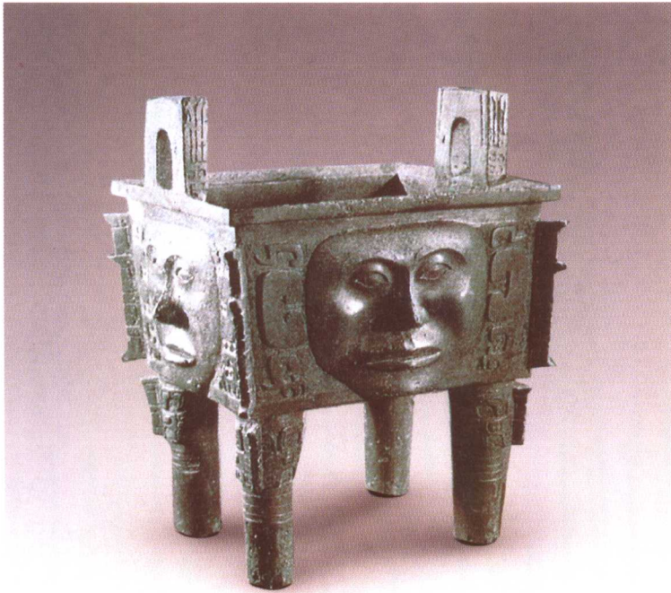
人面方鼎 商代后期 湖南宁乡黄村出土