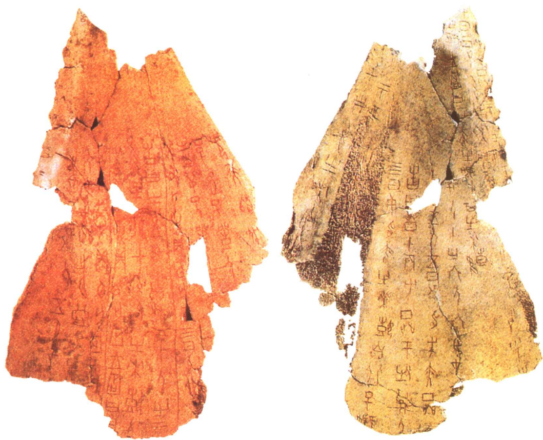
奴隶逃亡与征伐卜辞（正、反） 河南安阳出土