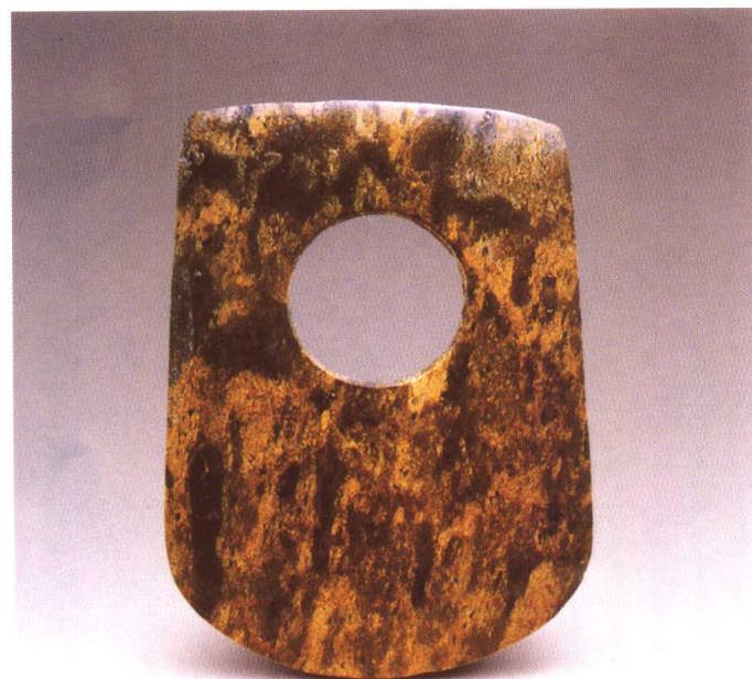
良渚玉钺 上海青浦福泉山出土