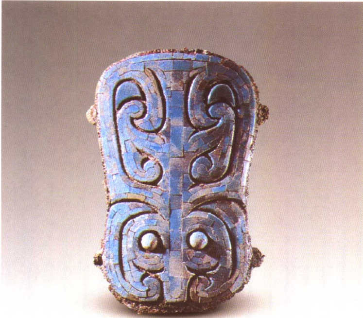
二里头文化牌饰 河南偃师二里头出土