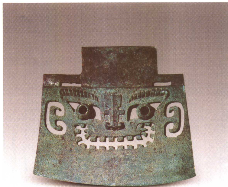
人面钺 商代后期 山东益都苏埠屯出土