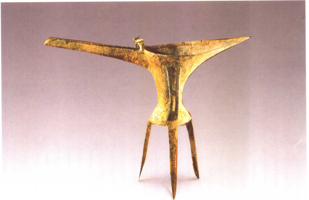
二里头文化铜爵 河南偃师二里头出土