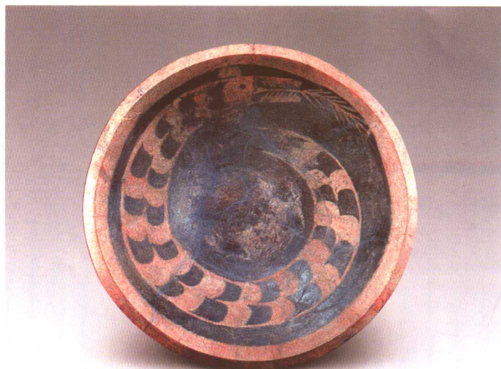
彩绘龙盘 山西襄汾陶寺墓地出土