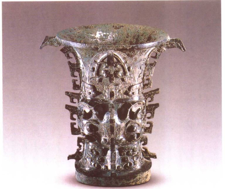
何尊 西周早期 陕西宝鸡贾村源出土