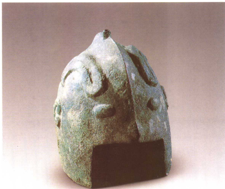
饕餮纹冑 商代后期 河南安阳出土