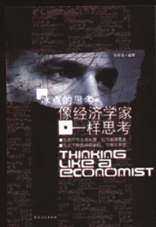
《像经济学家一样思考》