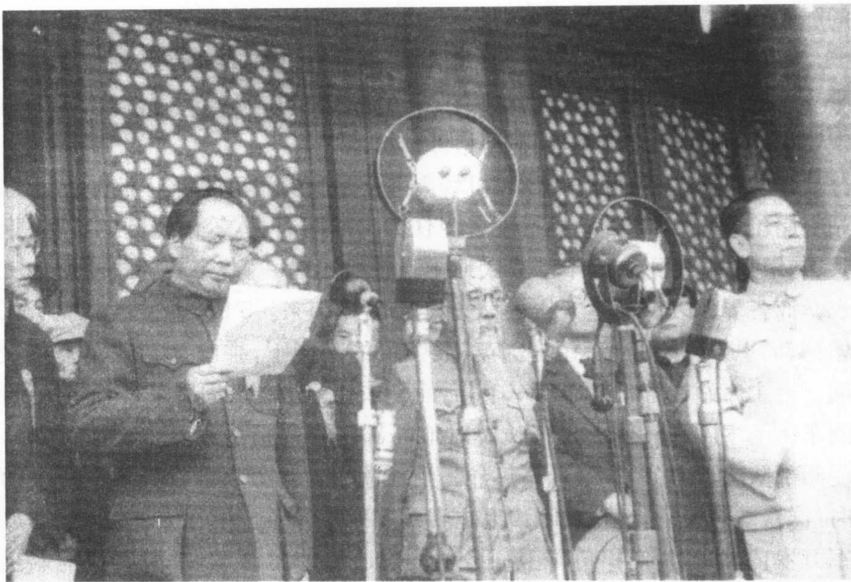
毛泽东在开国大典上宣告中华人民共和国中央人民政府成立

诞生了。6月初,我在中南海受领第20兵团布防平、津、塘、秦的任务时,听周恩来副主席谈了有关建国大计的内容。“七一”后,中共中央成立了以周恩来为主任,彭真、聂荣臻、林伯渠、李维汉等同志为副主任的开国大典筹备委员会,拟定开国大典包括三大项目:一、中华人民共和国中央人民政府成立典礼;二、中国人民解放军阅兵仪式;三、人民群众游行活动。