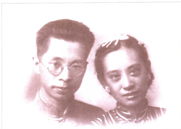
罗念生与夫人马宛颐合影