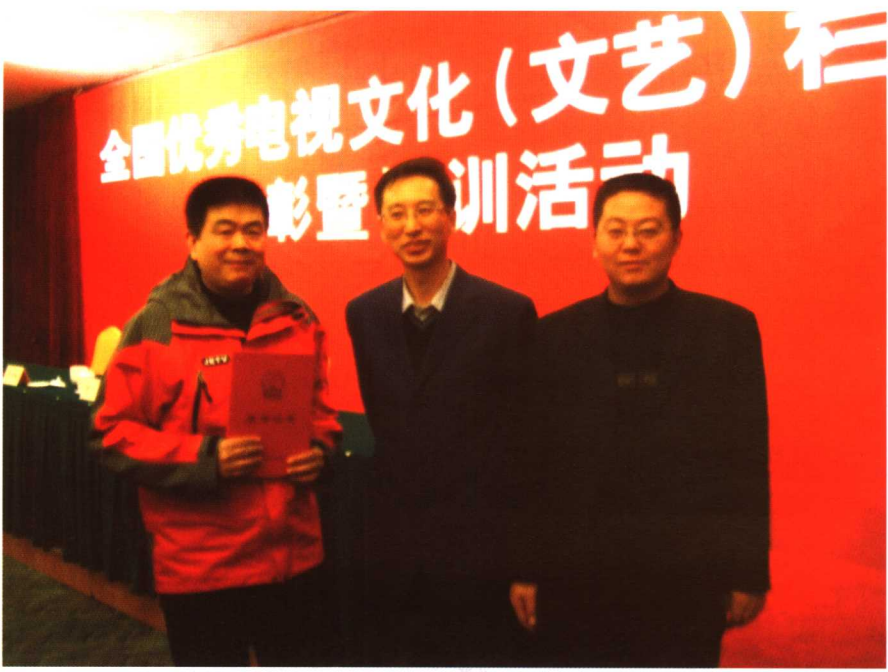
国家广电总局副局长胡占凡 和《语林漫步》栏目获奖人员亲 切合影