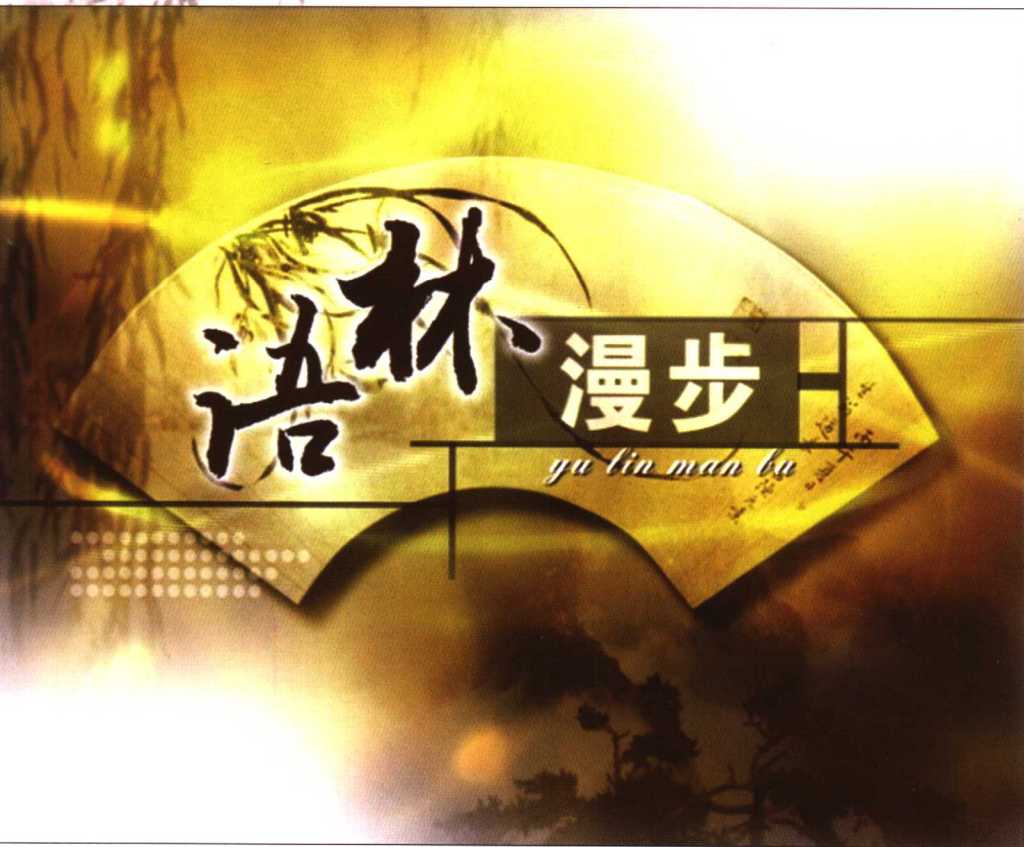
《语林漫步》栏目标识