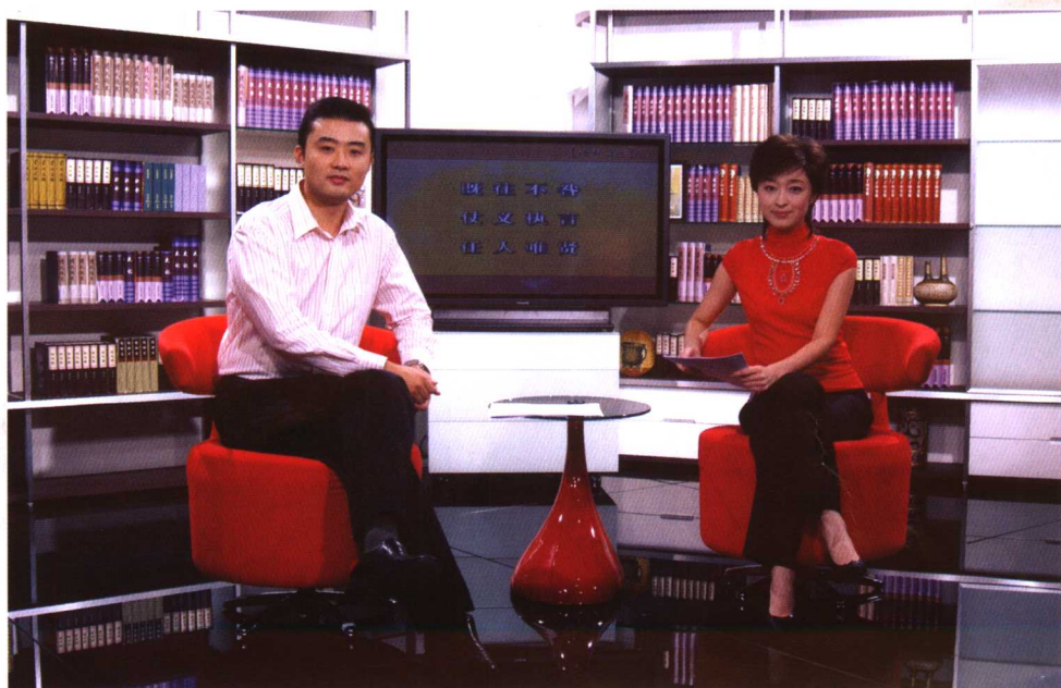
改版后的栏目场景，现代明快，书卷飘香