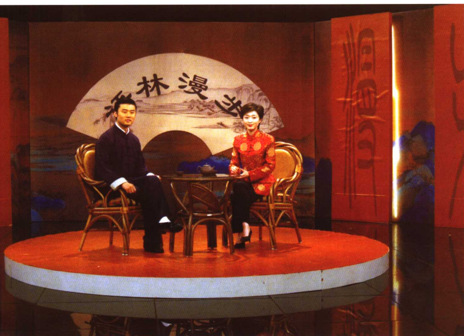
早期的栏目室场景，典雅厚重，韵味十足