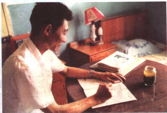
出差时在宾馆挑灯夜战