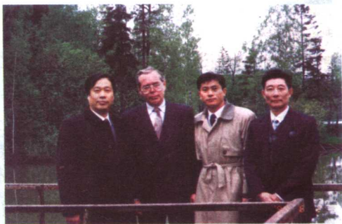
法制日报赴俄罗斯新闻访问团 部分成员在莫斯科