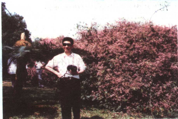
法制日报地方版云南会议后就地采访