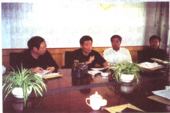
在全国记者会上谈抓头条新闻