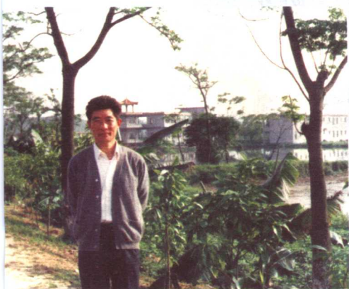
在广州召开的全国记者会期间