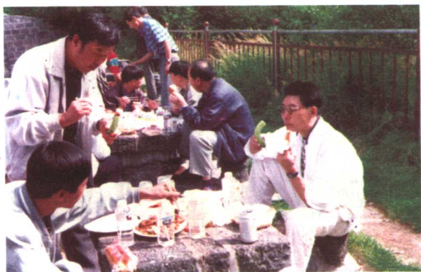
在吉林省长白山采访时野外就餐