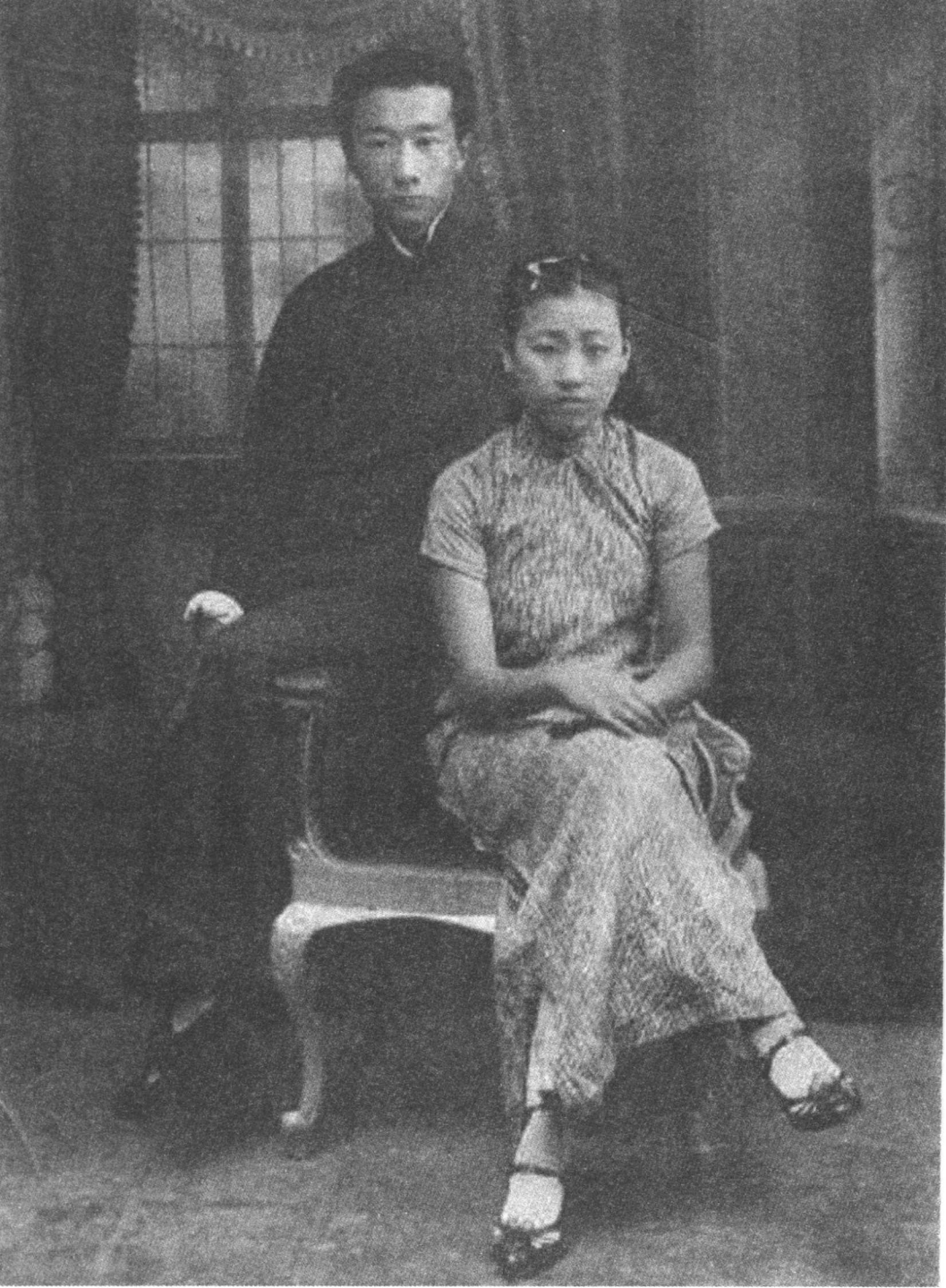
周汝昌与夫人毛淑仁