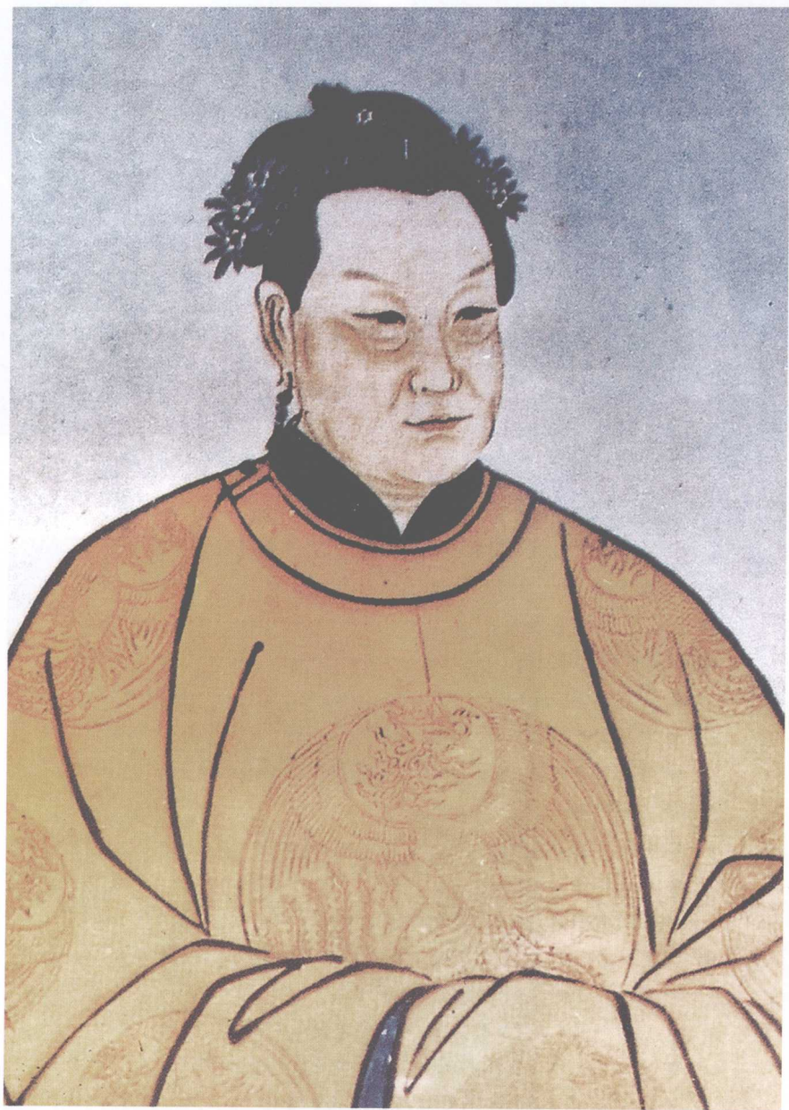
图 17 马皇后画像