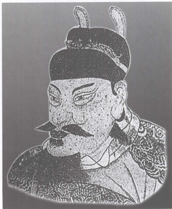
图 16 朱元璋画像 （八字须像）