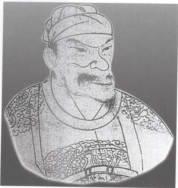
图 13 朱元璋画像 （尖下巴像）