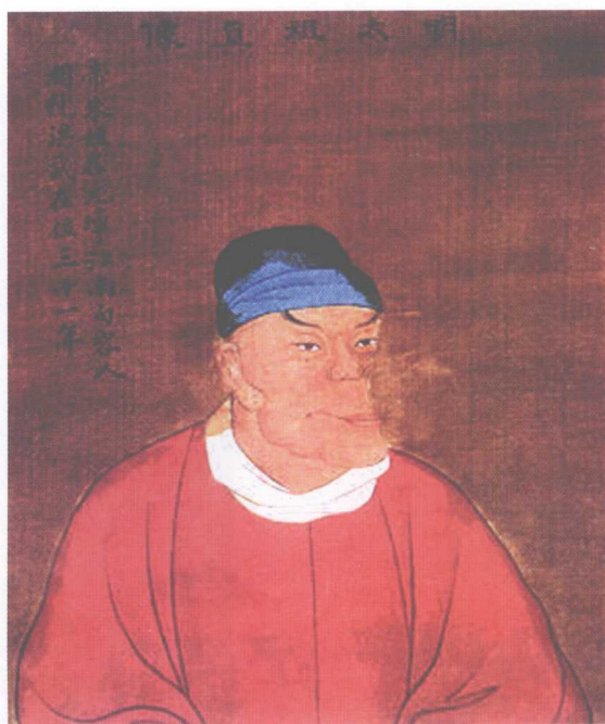
图 11 朱元璋画像 （头巾像）