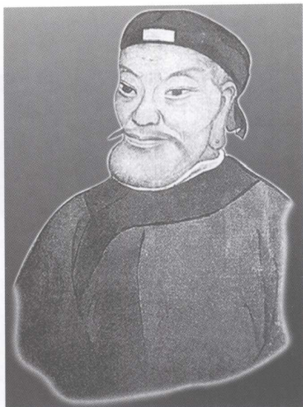
图 15 朱元璋画像（乡老像）