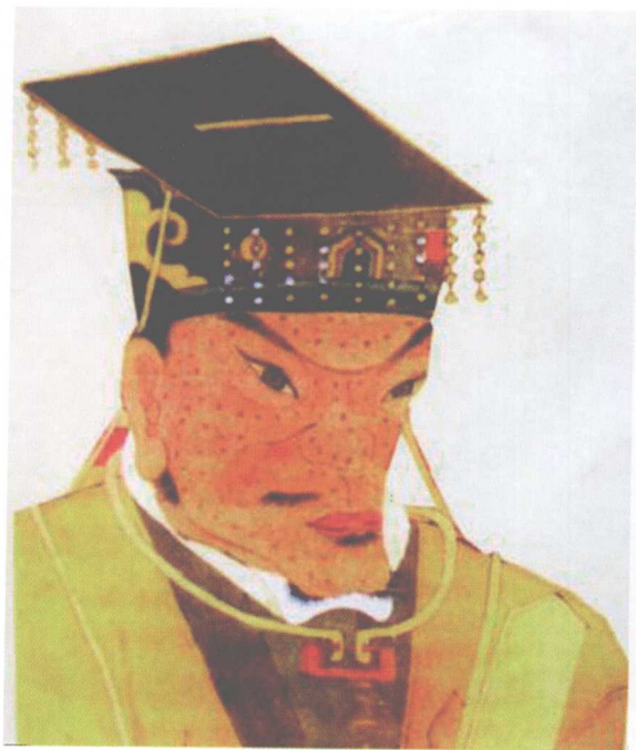
图 12 朱元璋画像（凶光相）