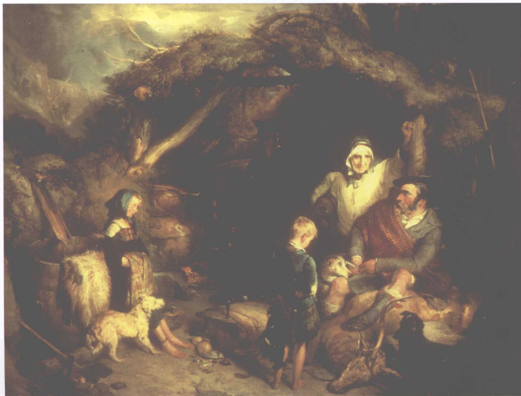
埃德温·亨利·兰斯爵士于19世纪20年代所绘“高地威士忌蒸馏”

另外还有一点很重要你必须记住，只有当烈酒被出售才会征收税率。“自家酿造”是完全合法的。所以只要威士忌是由自己种植的谷物在小型蒸馏器中酿制并且用于家庭消费……这就引出了我的第三个重要的日子：