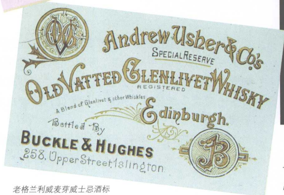
老格兰利威麦芽威士忌酒标