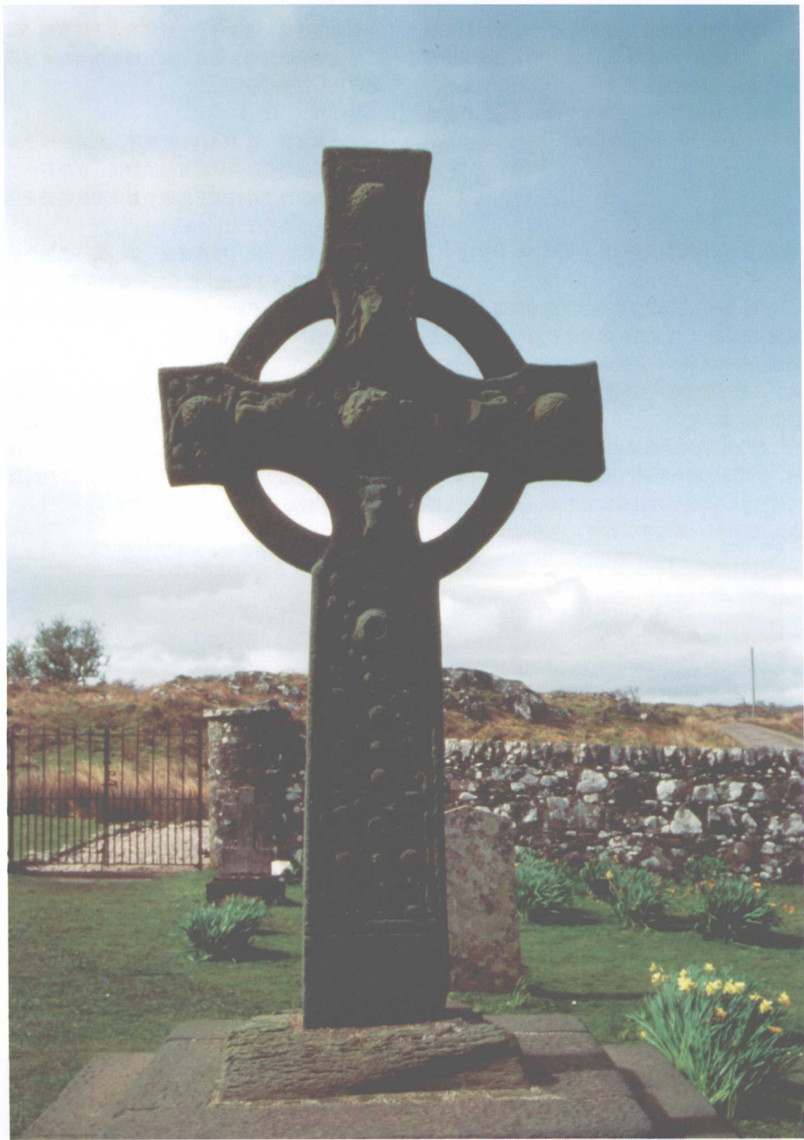
艾莱岛上的基达尔顿十字架