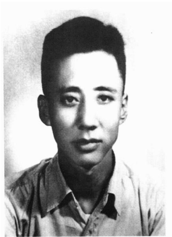
一九五〇年摄于天津