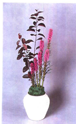
②按同样高低错落的方法，插制一丛蛇鞭菊