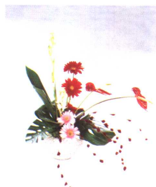
⑤卷2枝黄金鸟叶与干花红色线条分别插入左右