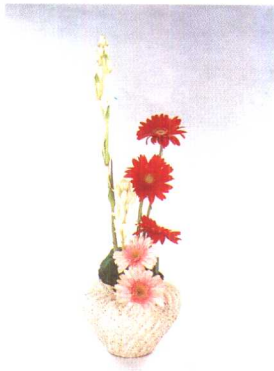
②晚香玉右边插入3枝红色非洲菊