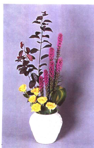
③瓶口处插入绿叶和黄玫瑰