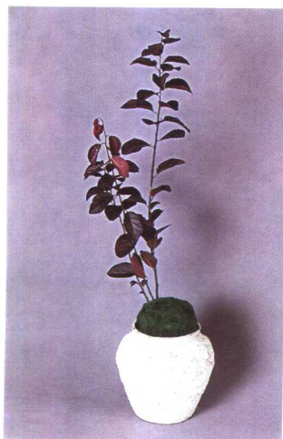
①紫叶李叶一高一低形成高低错落插于盆边