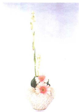
①晚香玉2枝，一高一低插入，瓶底部插入2枝非洲菊