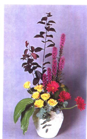
④蛇鞭菊下插入一丛非洲菊，并用玉簪叶使作品平衡，用尤加利叶片填盖花泥