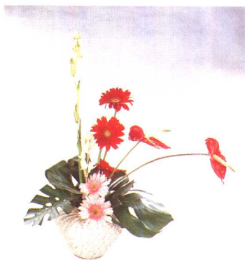
④左边、右边、后边分别插入龟背竹叶