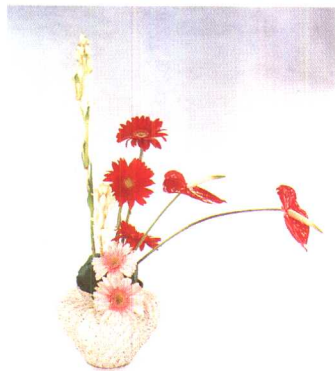
③红色非洲菊旁斜插2枝红掌