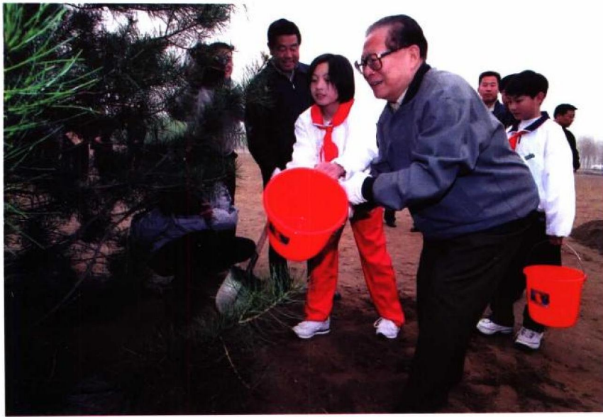
2002年4月6日，中共中央总书记、国家主席江泽民来到北京朝来森林公园，参加全民义务植树活动