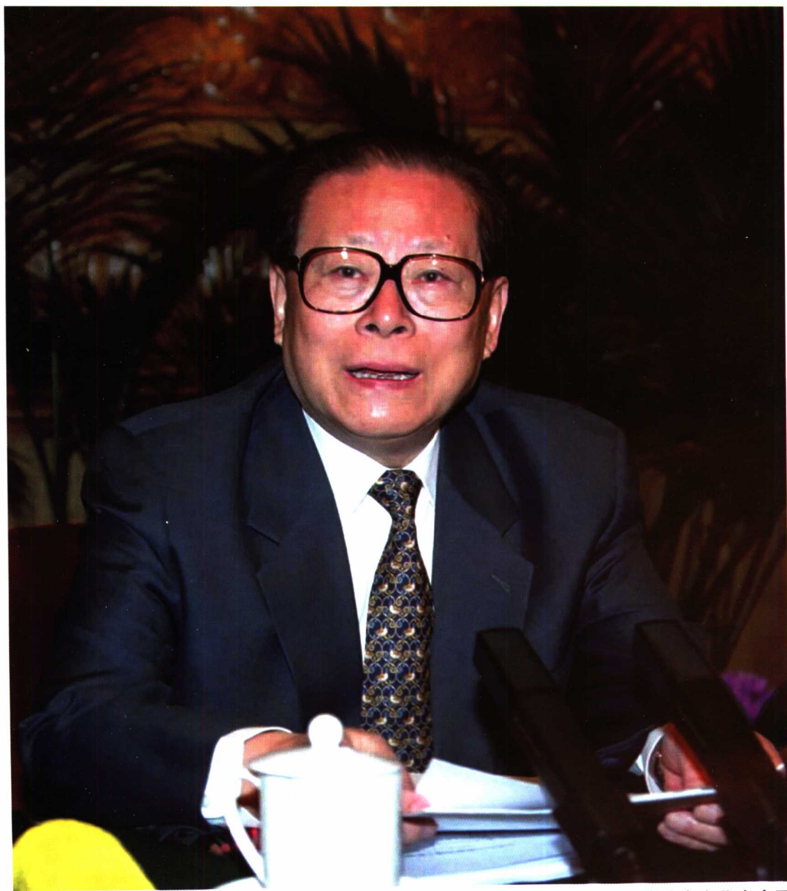
2002年3月10日，中央人口资源环境工作座谈会在北京人民大会堂举行。中共中央总书记、国家主席江泽民主持座谈会并发表重要讲话