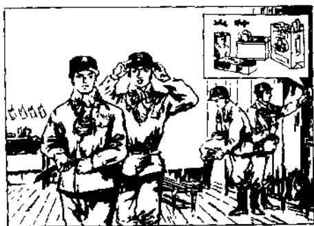
图 2-2 穿戴整齐排队下井

进出罐笼、上下车，服从指挥要自觉。 罐、车之内守纪律，不许打闹和拥挤。 乘人车，且莫站，不准用手扒车沿。 斜巷行车不行人，声光信号要留神。 皮带、溜子不能坐，严禁爬、蹬和跳车。 来往车辆看仔细，跨越轨道要注意。