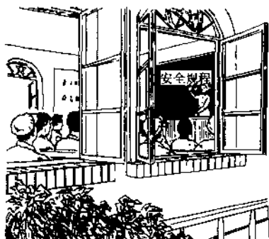
图 2 1 下井前学规程

下井前，莫忘记，带好矿灯自救器。 化纤衣服不能穿，禁带火具和香烟。 矿工靴，要穿好，时刻戴牢安全帽。 不喝酒，休息好，精力集中效率高。 持证上岗要牢记，井下处处要注意。 导电材料和工具，严防接触带电体。 尖刃工具要套上，防止意外把人伤。 带着工具乘车罐，不准超出车、罐帮。