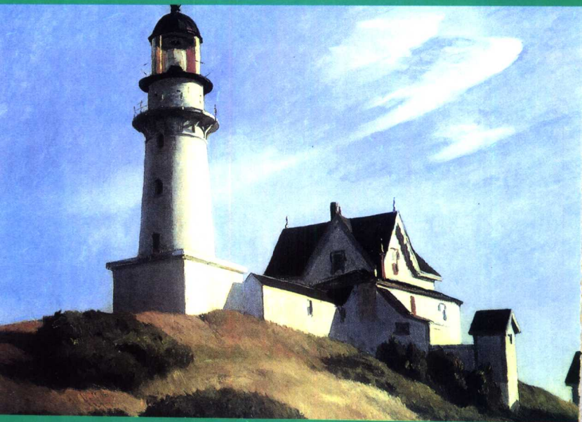
灯塔 [美]爱德华·霍珀