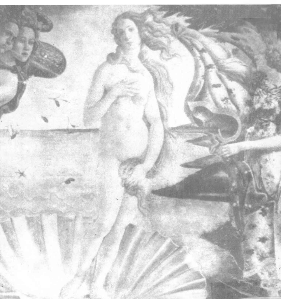
维纳斯的诞生 [意] 波提切利