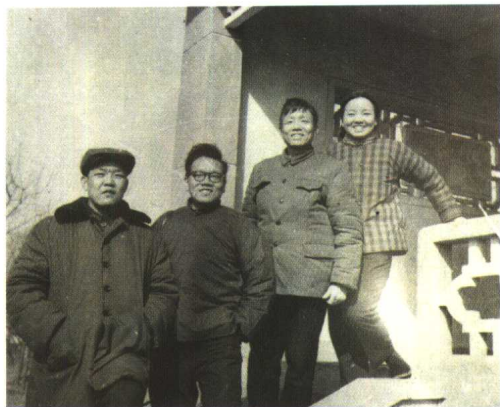
1970年，父亲为我们四兄妹拍的照片