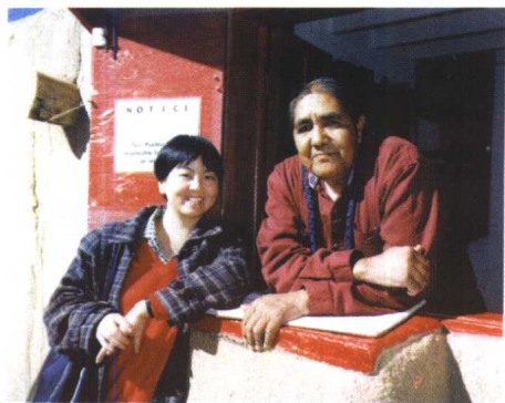
1997年秋，在美国新墨西哥州印地安人居住地 与印地安人