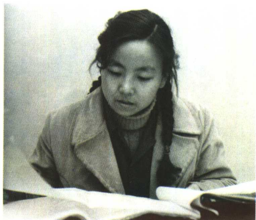
1982年，刚从武汉大学毕业，一本正经地当电视剧编辑