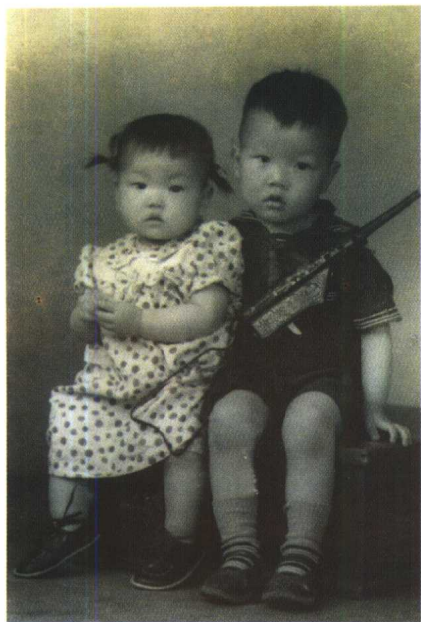
1956年，一岁的时候与小哥