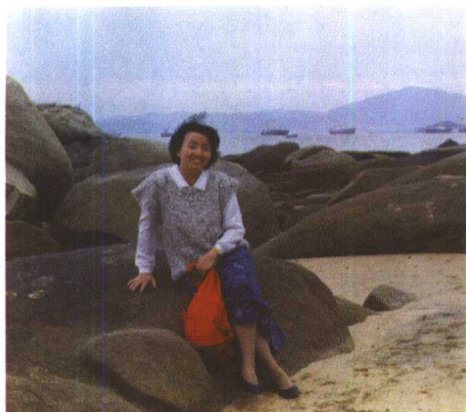
1990年秋，在鼓浪屿海边