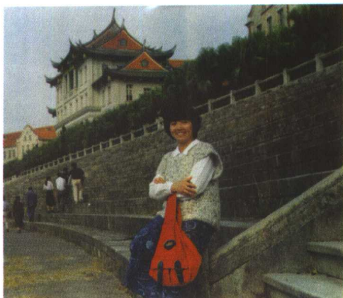
1990年秋，背后是美丽的厦门大学