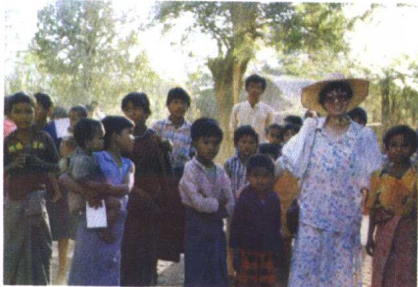
1989年冬，和缅甸的小孩在一起