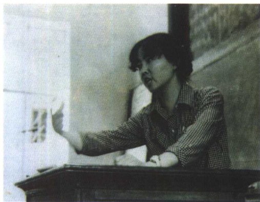
1982年夏，在大学毕业前夕诗歌讲座上