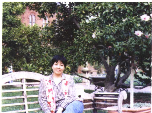
1997年秋，在华盛顿一家艺术馆的庭院里