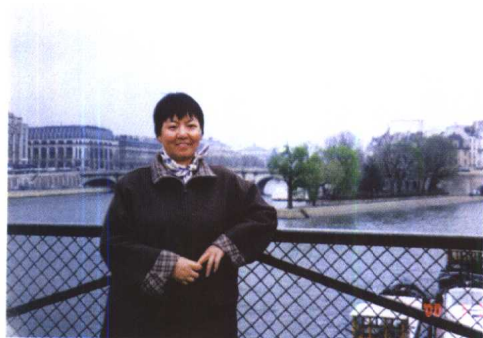
2000年春，在巴黎塞纳河边