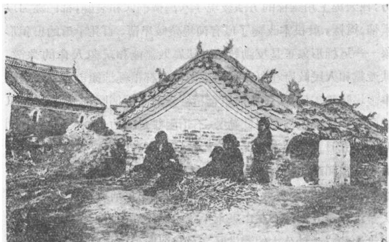
一九三三年黃河泛濫時被泥沙淤沒的房屋

產的慘重損失，常常有整個村鎮甚至整個城市人口被大部或全部淹沒的慘事。一九三三年的洪水造成決口五十餘處，受災面積一萬一千餘平方公里，受災人口三百六十四萬餘人，死亡一萬八千餘人，損失財產以當時銀洋計約合二億三千萬元。一九三八年蔣介石政府在河南鄭州附近掘開南岸花園口河堤，造成黃河大改道，受災面積五萬四千平方公里，受災人口一千二百五十萬人，死亡八十九萬人。由此可見黃河災害的嚴重程度。