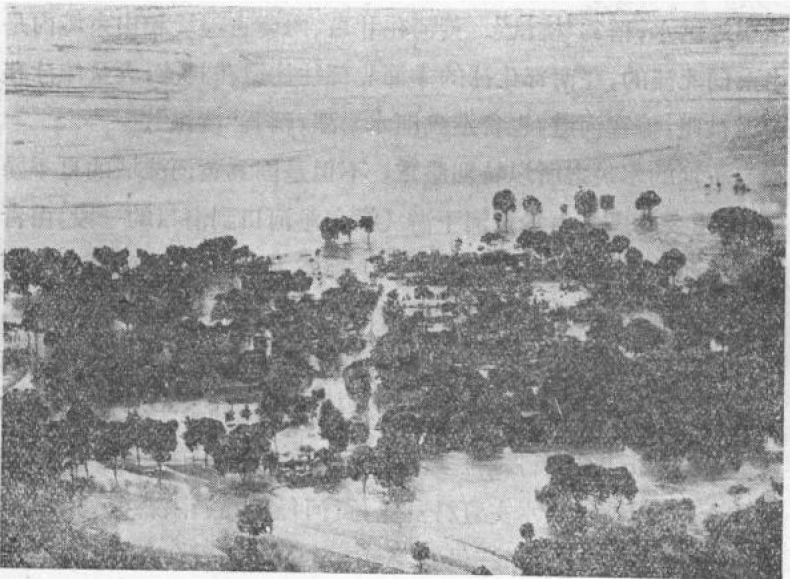
一九三三年黃河在蘭封決口後被淹沒的村莊

由於上述情況，黃河雖然在中游也有水災，但嚴重的水災却集中在下流。據歷史記載，黃河下流在三千多年中發生泛濫、決口一千五百多次，重要的改道二十六次，其中大的改道九次。改道最北的經海河出大沽口，最南的經淮河入長江。因此黃河的災害一直波及海河流域、淮河流域和長江下流，威脅二十五萬平方公里上八千餘萬人口的安全。黃河的每次泛濫、決口和改道都造成人民生命財