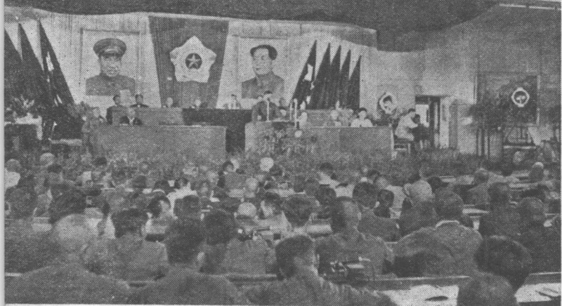
全國戰鬥英雄，勞動模範代表會議會場