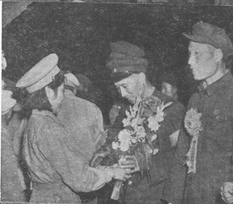
(上) 出席會議的工業勞動模範 向毛主席朱總司令獻旗 (右) 到車站歡迎的部隊代表向 勞動模範獻花 (下) 中國人民解放軍戰鬥英雄 會師北京