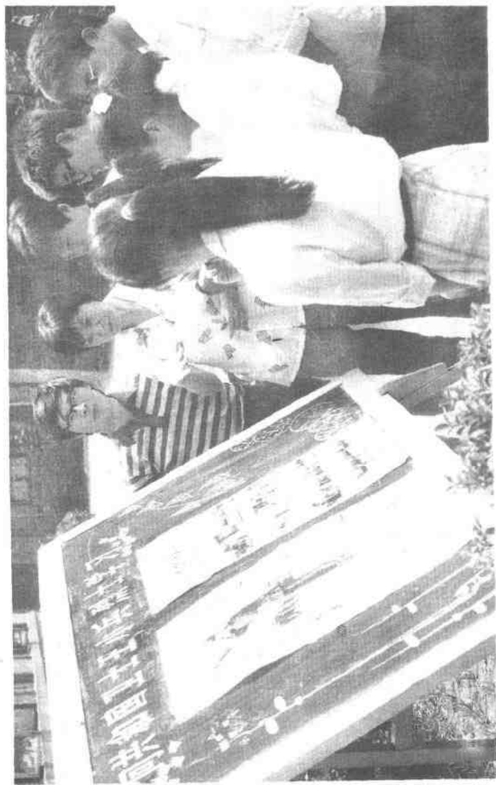
西安市的中小学掀起向王小兵、李强烈士学习的高潮。图为西安44中的师生参观烈士事迹展览。