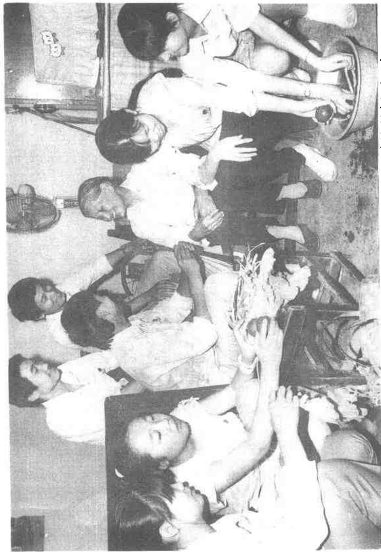
西安市第44中学高一2班，在“共和国卫士”事迹的鼓舞下，在暑期中仍坚持每天到孤寡老人陈奶奶家帮她料理家务。