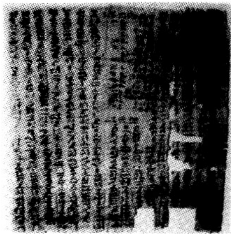
古埃及的莎草纸书

古代埃及文明约始于公元前 4000 年左右。埃及经历了拜达里文化（约公元前 5000 年 ~ 公元前 4000 年）、阿姆拉文化（约公元前 4000 年 ~ 公元前 3500 年）、格尔塞文化（约公元前 3500 年 ~ 公元前 3100 年），于公元前 3100 年出现了统一的国家。古埃及的历史一般可分为古王国（约公元前 2686 年 ~ 公元