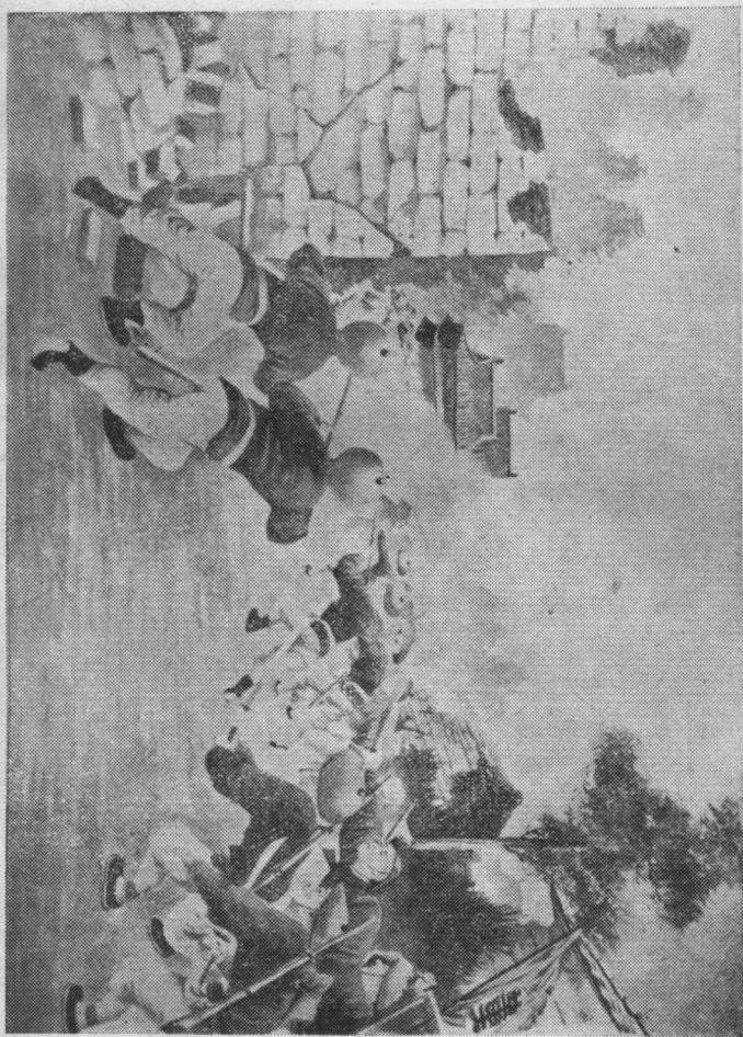
童國祥軍進攻盤踞王宮的日本侵略軍