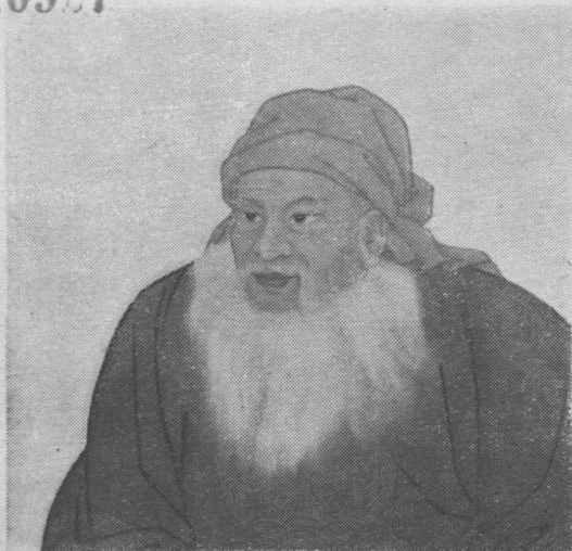
义和团领袖张德成