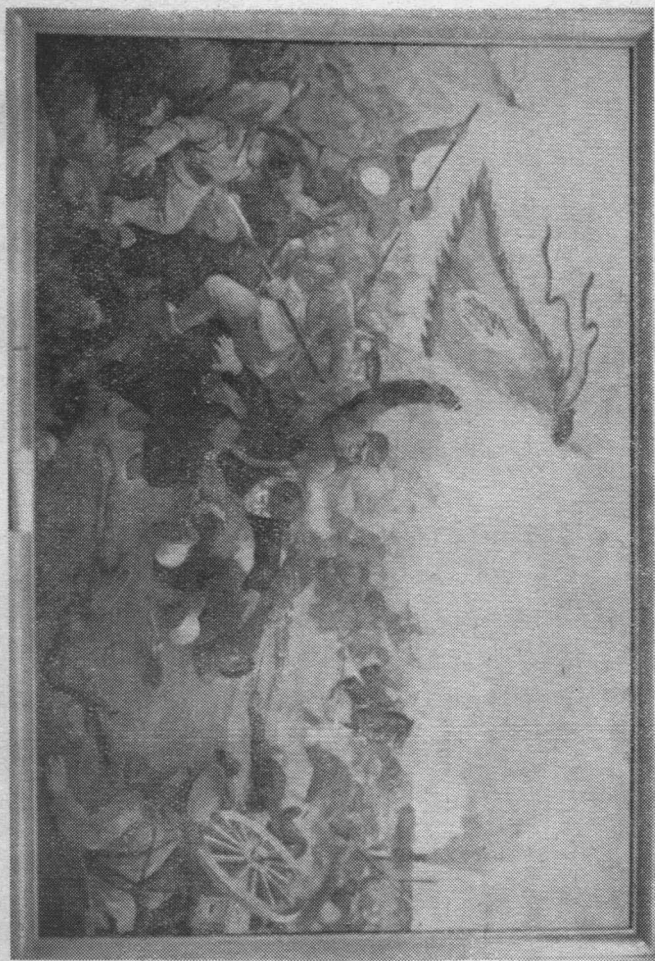
义和团在廊坊痛击侵略军