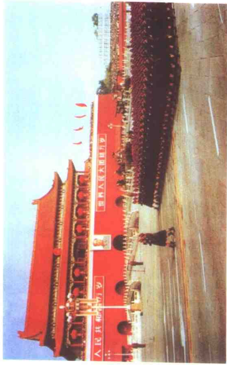
1984年10月1日，中华人民共和国成立35周年阅兵，北京军区军医学院女兵方队通过天安门广场，接受党和国家领导人检阅