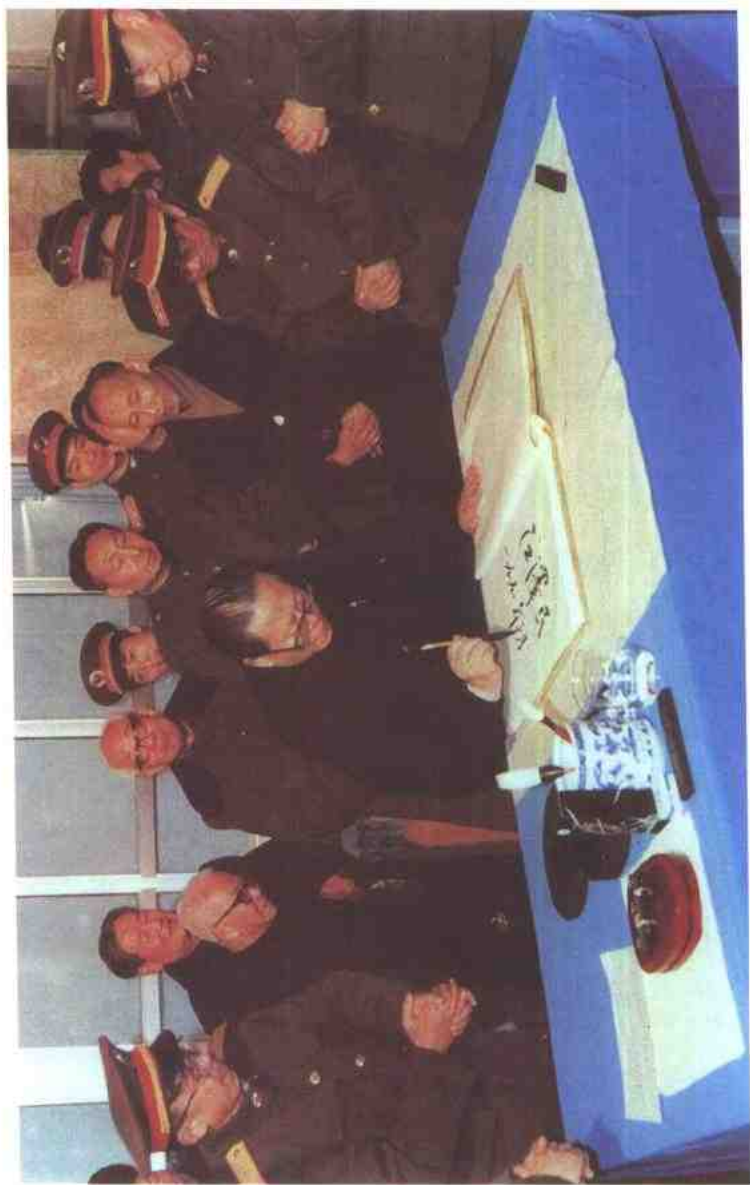
1991年1月12日，中央军委主席江泽民视察中国人民解放军农牧大学，并为该校题词